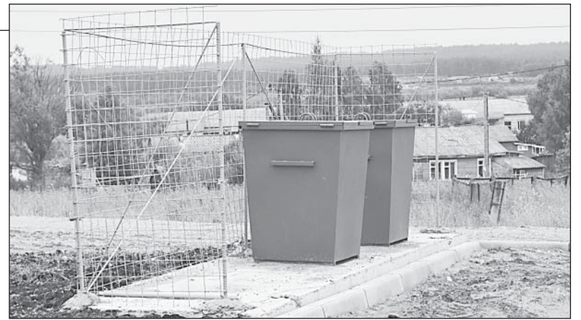
Контейнеры у нового дома на Кошеве. В перспективе так будут выглядеть все места сбора мусора в Верховажье

Но это хоть и в ближайшей, но перспективе. А что сейчас? Постепенно отношение верховажан к централизации услуги меняется. По словам руководителя управляющей компании, люди поверили в необходимость перемен и пусть пока не