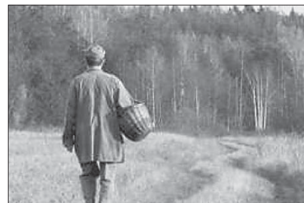
Отправляясь в лес, сообщите родным, куда и на какое время вы уходите

- Хорошо, что все хорошо заканчивается, - гово-