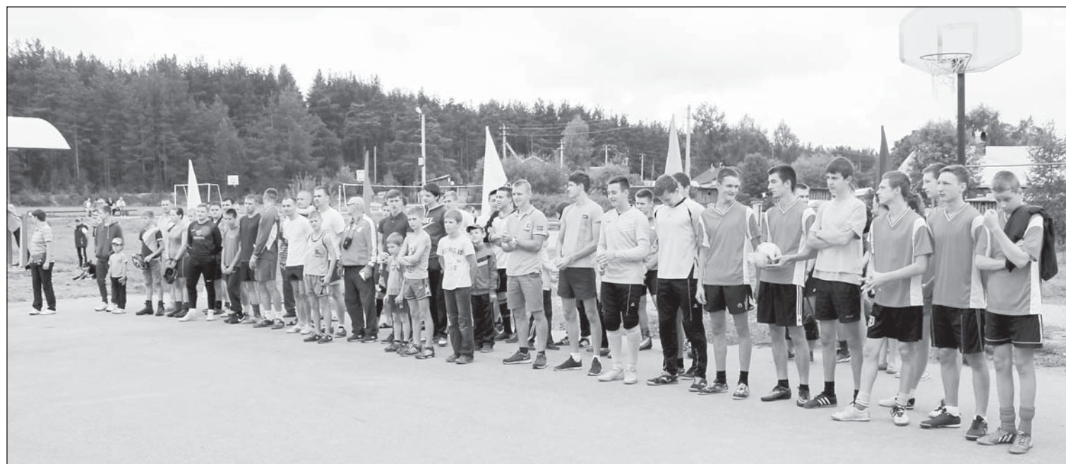
Построение участников соревнований