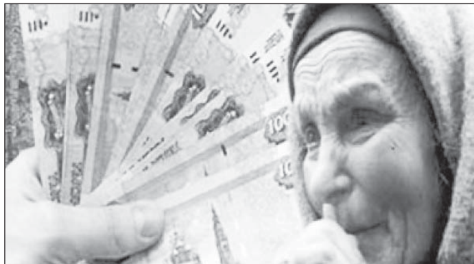
За сущую безделицу такие деньги отдала?!

Приплывшись домой, героиня нашего рассказа села к столу, привиднула телефонный аппарат и начала обзванивать родных и знакомых, которые могли воспользоваться телефоном.