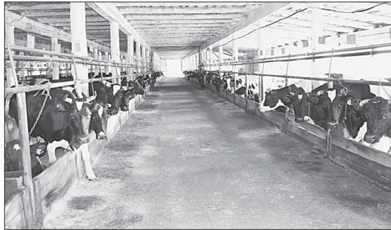
На Урусовской ферме СПК колхоза «Нижне-Кулово»

Вологодская область по производству молока на одного жителя за последние годы стабильно занимает с 1 по 3 место в России. Регион находится в десятке лидеров по надоям молока на одну корову. Крупный рогатый скот по генетике — один из лучших в России. Только за шесть месяцев с начала года Вологодская