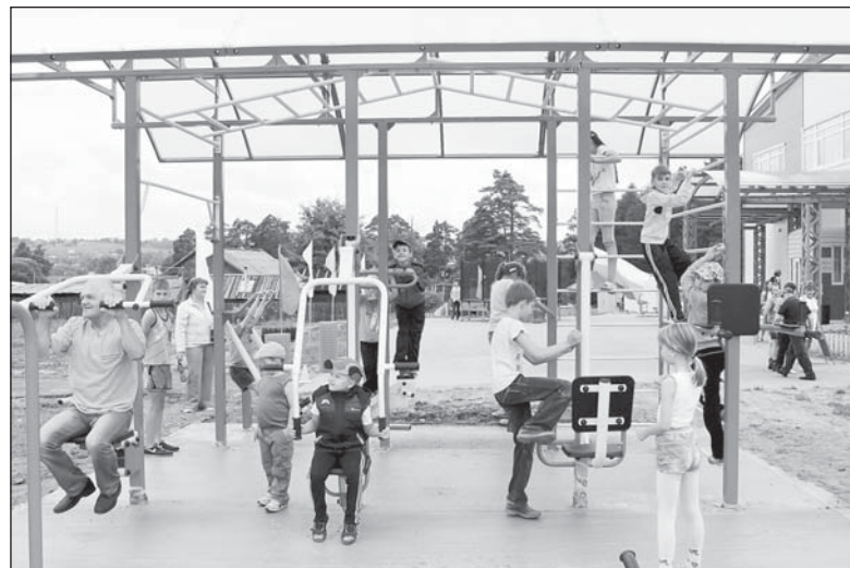
На новой спортивной площадке