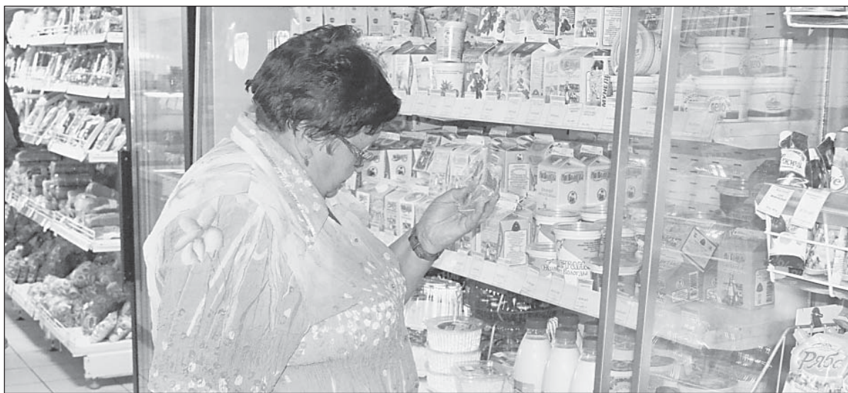
Продовольственное эмбарго на ассортименте верховажских магазинов не отразилось

Думаю, читателям будут интересны несколько цифр, приведенных выступившим перед верховажскими аграриями начальником областного департамента сельского хозяйства Николаем Анищенко : «В области удалось стабилизировать поголовье коров. Повышается «качество» скота по породам и генетике. У нас сейчас имеются элитные породы скота. Так вот в наших хозяйствах есть коровы, которые доят по 60 литров в день. С учетом этого достижение ориентира в 6,5 тысяч килограммов молока от коровы не выглядит несбыточным. За первое полугодие в среднем от коровы уже получено более 3 тысяч килограммов.