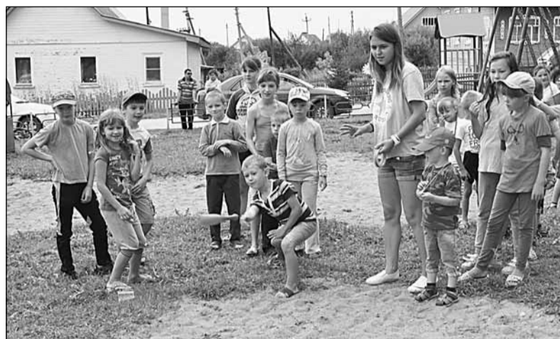
Сбить все кегли точным броском не так-то легко