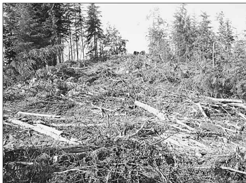
Так выглядит делянка после вырубки