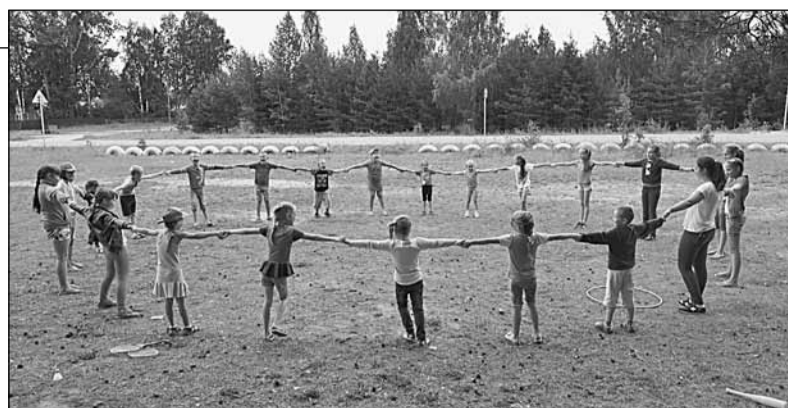
Разминка перед «Веселыми забегами» на стадионе Теплого Ручья

На 13 августа заявки поступили от 27 жителей и организаций района. На конец недели в конкурсе участвуют представители восьми сельских поселений: Верховажского, Верховского, Морозовского, Нижнекулойского, Шелотского, Чушевицкого, Липецкого и Наумовского.