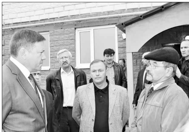
Отчет о проделанной работе губернатору во время открытия дома для переселенцев из аварийного жилья на Кошево, 2013 год