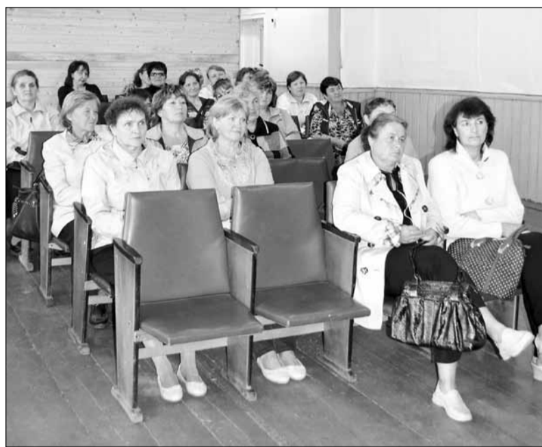
Пришедшие на встречи не только слушали, но и задавали много вопросов