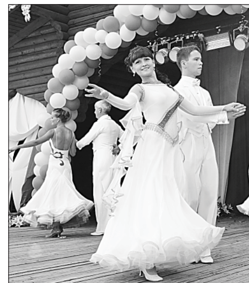
Танцевально-спортивный коллектив «Комильфо».