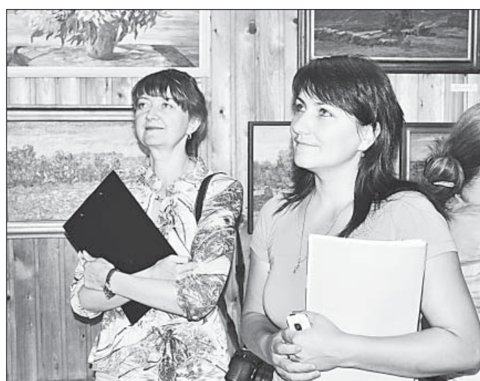
В выставочном зале.