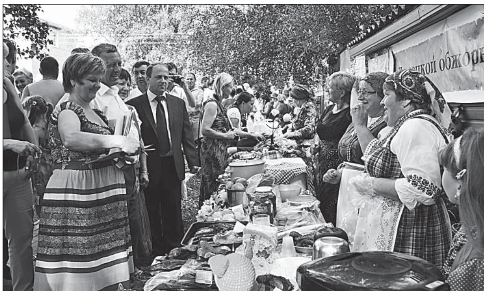
На Аллее мастеров.