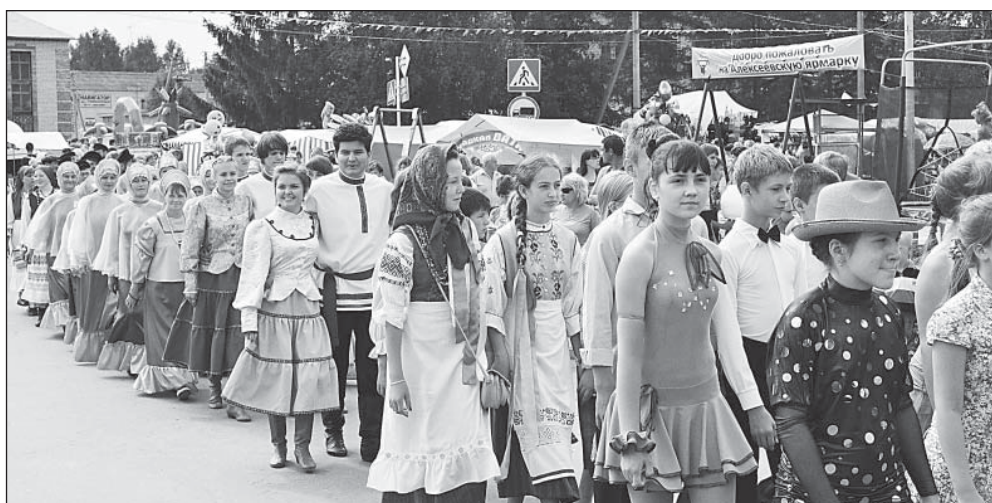
Парад творческих коллективов.