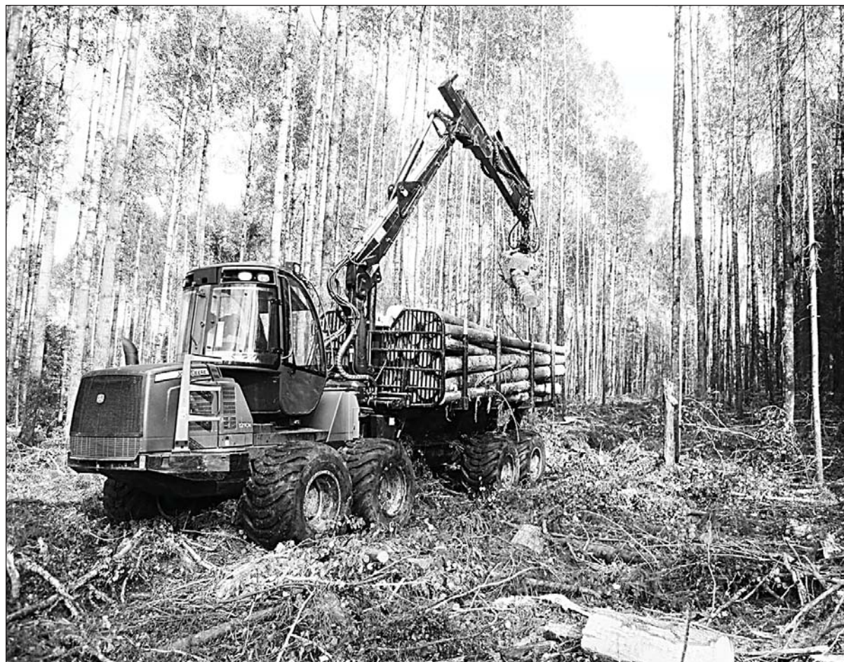
Форвардер в лесу.