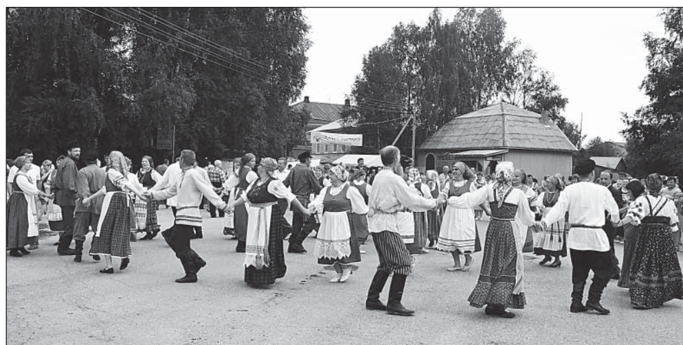
Хоровод «Заплетайся, плетень».