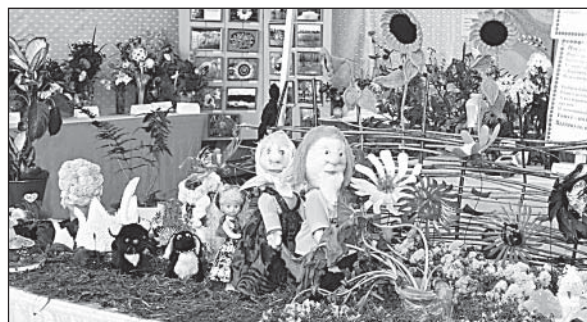
«Посадил дед репку» (Шелотская школа).