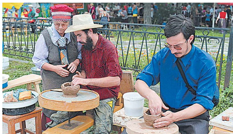
На мастер-классе по глине.