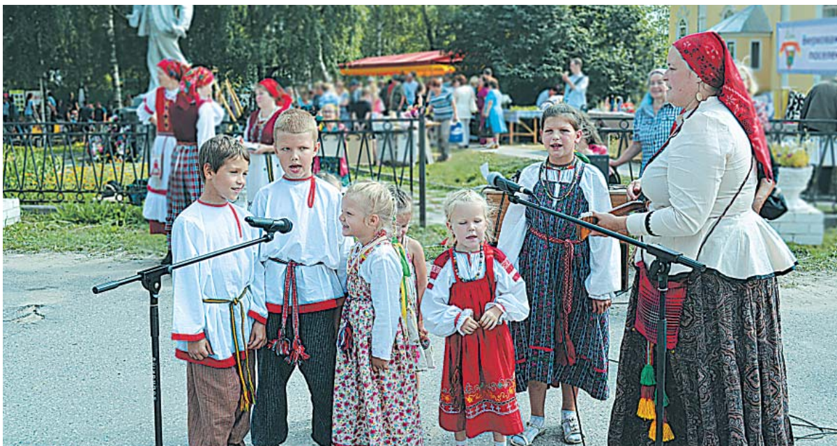
Гости из Москвы.