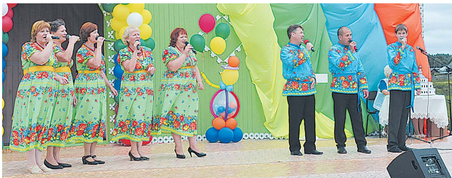
Выступает вокальная группа «Настроение».