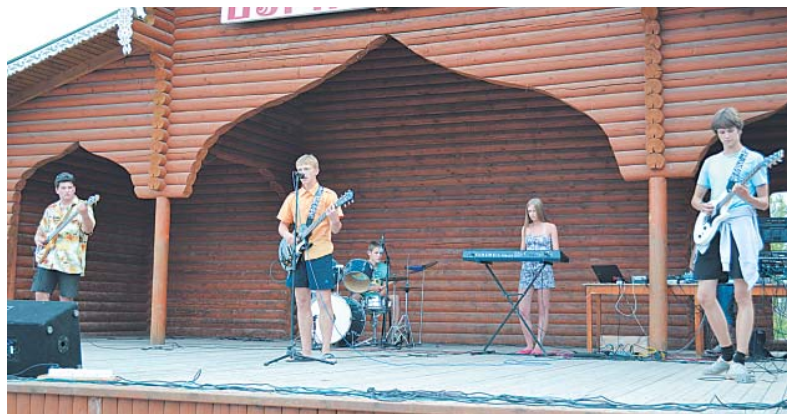
Выступление на Дне молодёжи.

В рамках Алексеевской ярмарки в завершающей вечер ретро-программе на сцене перед несколькими сотнями зрителей выступил коллектив группы «Вектор». Восторженные крики толпы, яркие огни, громкая музыка — всё, как на настоящем рок-концерте.