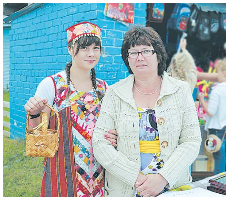
Бойко шла торговля сувенирами.