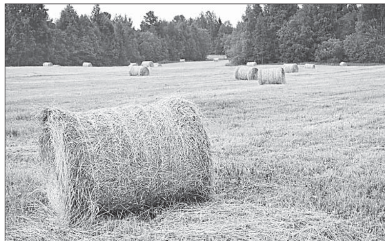
Сено пока еще в полях.

Позвонила я ещё в одно сельхозпредприятие района - колхоз «Липки». Его агроном