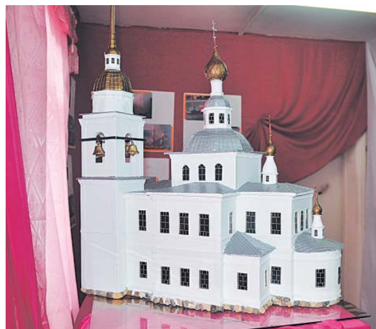
Макет храма Покрова Пресвятой Богородицы в Кулое.