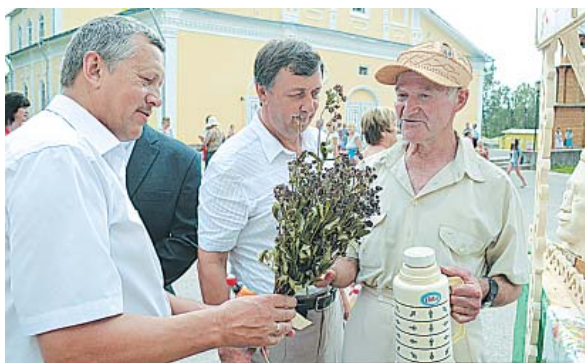
На конкурсе «Важкое чаепитие».

Центральной районной больницы, пожелали всем здоровья и напоили полезным травяным чаем. Альтернативный чай молодости рекламировали представители молодёжи.