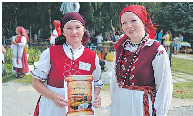
Награждение участников районного конкурса «А мы не забыли, как наши предки жили».