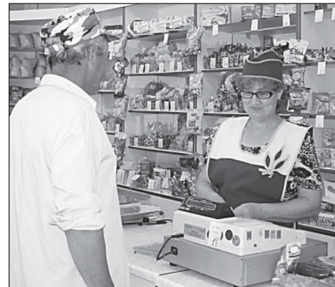
В олюшинском магазине.

В Олюшине всего два магазина, плюс развозная торговля. Все товары повседневного спроса есть. В винно-водочном отделе на витрине увидели даже красиво оформленную бутылку