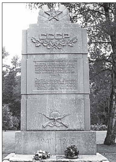
Памятный знак советским военнопленным, замученным в фашистском плену, в Витцендорфе, ФРГ.