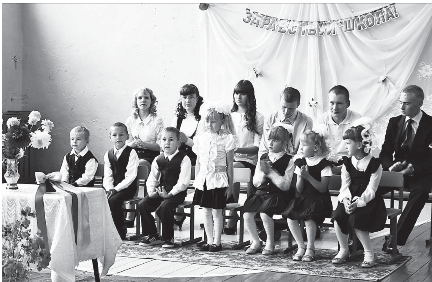
Главные герои Дня знаний — первоклассники и выпускники. В этом учебном году в Нижнекулойской средней школе шесть 11-классников и семь первоклашек.