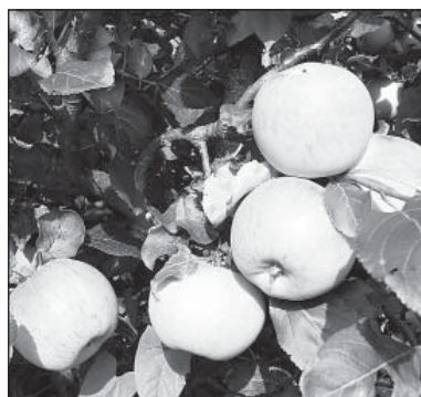
То самое «Башкирское чудо» крупным планом.