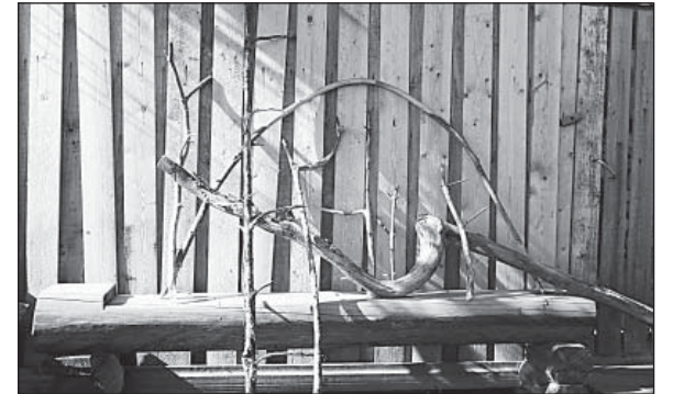
Образцы Витино «вооружения».