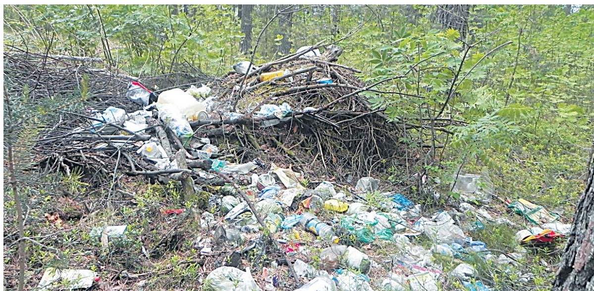
Такие кучи мусора в бору не редкость.