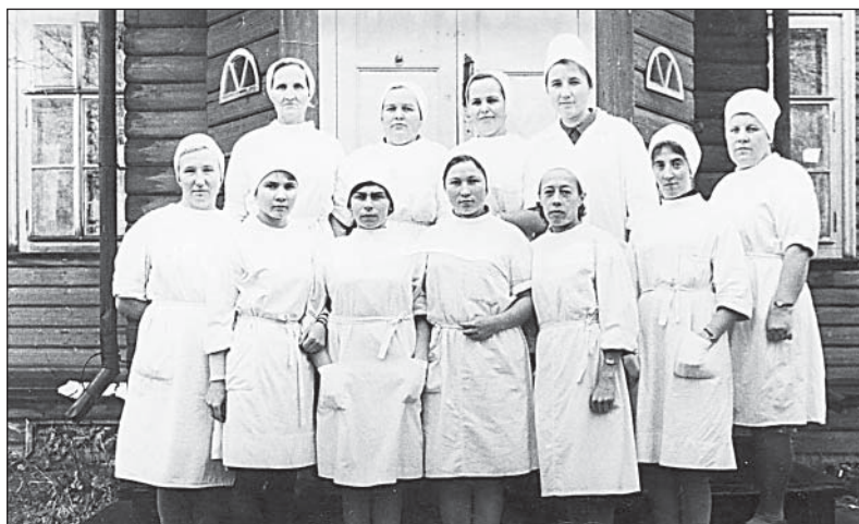
Коллектив хирургического отделения, 60-е годы.

вье, подарили радость жизни. Это десятки тысяч приемов, выездов к больным, медицинских обследований... В памяти Верховажан навсегда остались имена тех, к кому они с надеждой и верой обращались за