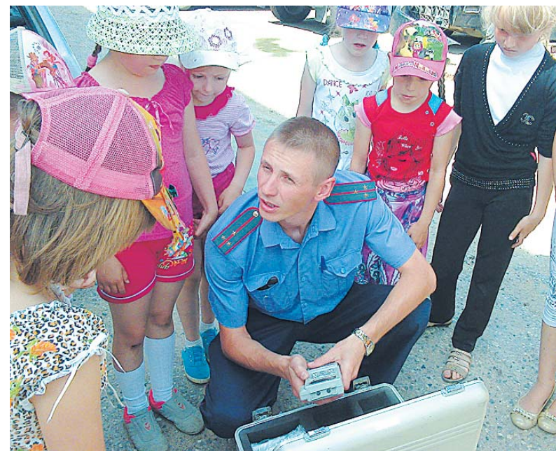
На экскурсии в полиции.