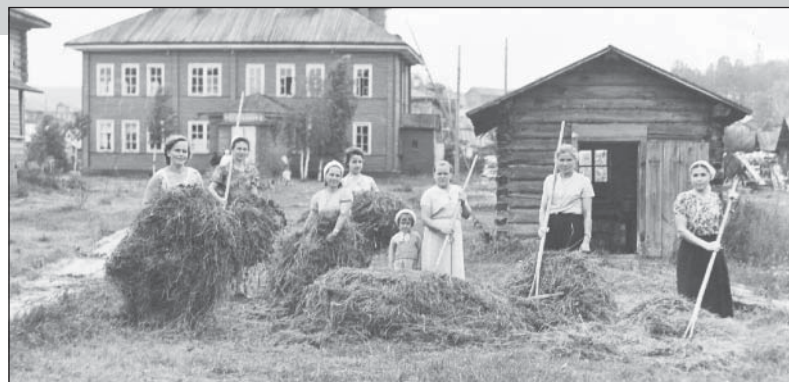
Работники поликлиники и хирургического отделения, 50-е годы.

История Верховажской районной больницы — это судьбы сотен докторов, фельдшеров, медсестер, санитарок. Это тысячи наших земляков, которым они вернули здоро-