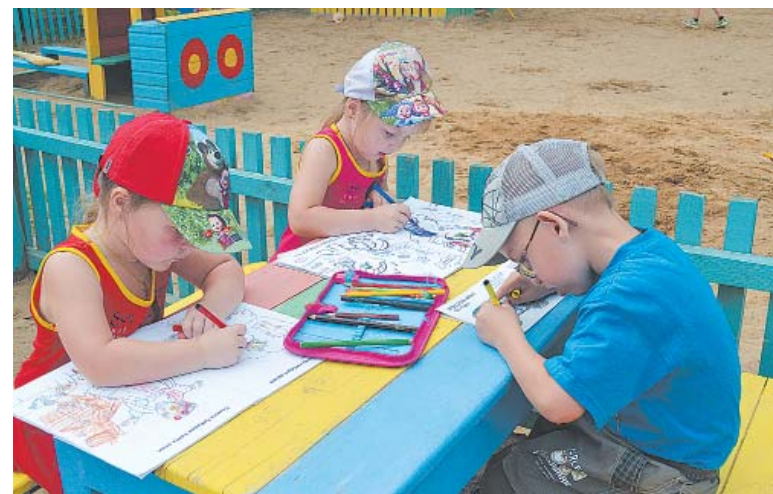
Дети рисуют даже на улице