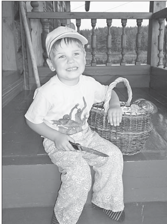
С богатым «уловом».

Подкрепившись, начинает одеваться. «Бабушка, где мои рабочие брюки?» Если проглядим, то кроме безобидного ножичка прихватит с собой и