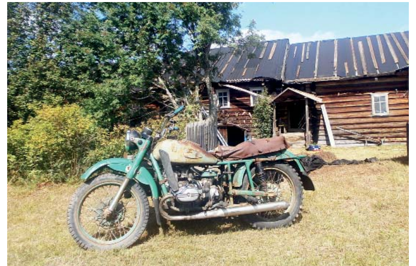
Для исторической точности (действие фильма происходит в 40-е годы XX века) раритетный мотоцикл привезен из Вельского района, а шифер на крыше дома закрыт черной тканью.

ящие трудяги. Они делали различные декорации, снимали не только днём, но и ночью. Обедали и ужинали в столовой – палатке здесь же, на территории деревни, а на отдых уезжали в Вельск.