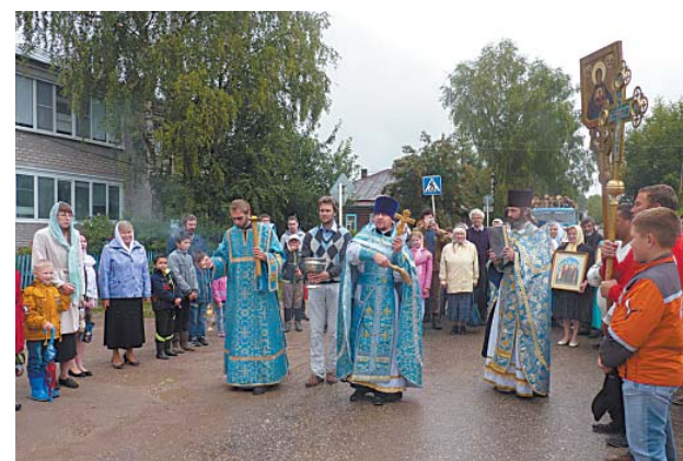
Крестный ход по улицам села.