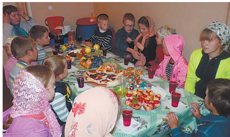
Детский стол на общей трапезе.