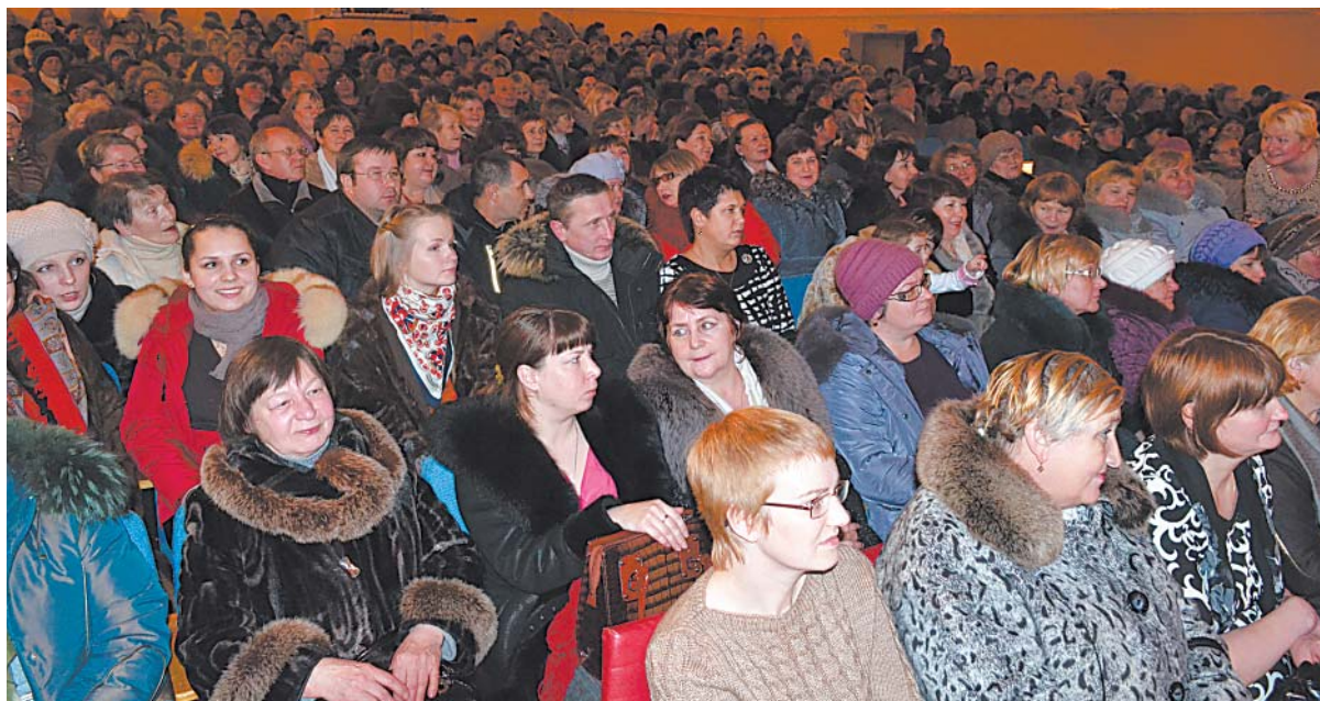
В этот вечер в зрительном зале яблоку было негде упасть.