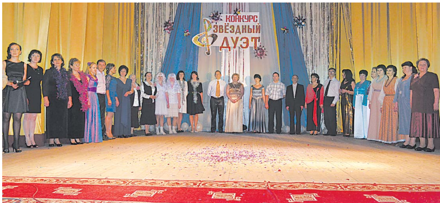
Участники волнуются перед награждением.