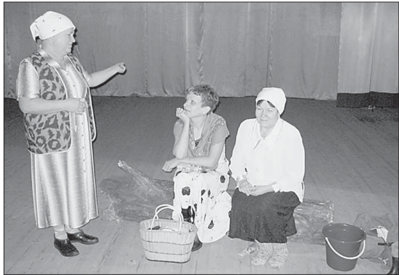
Сцена из спектакля.

Коллектив народного театра надеется, что спектакль вызовет интерес у зрителей, подарит встречу с любимыми артистами и знакомство с новыми.