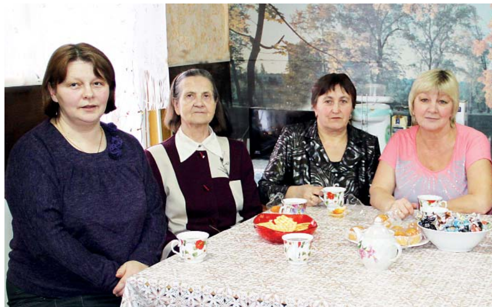
После розыгрыша мы пригласили общественную комиссию на чашечку чая.