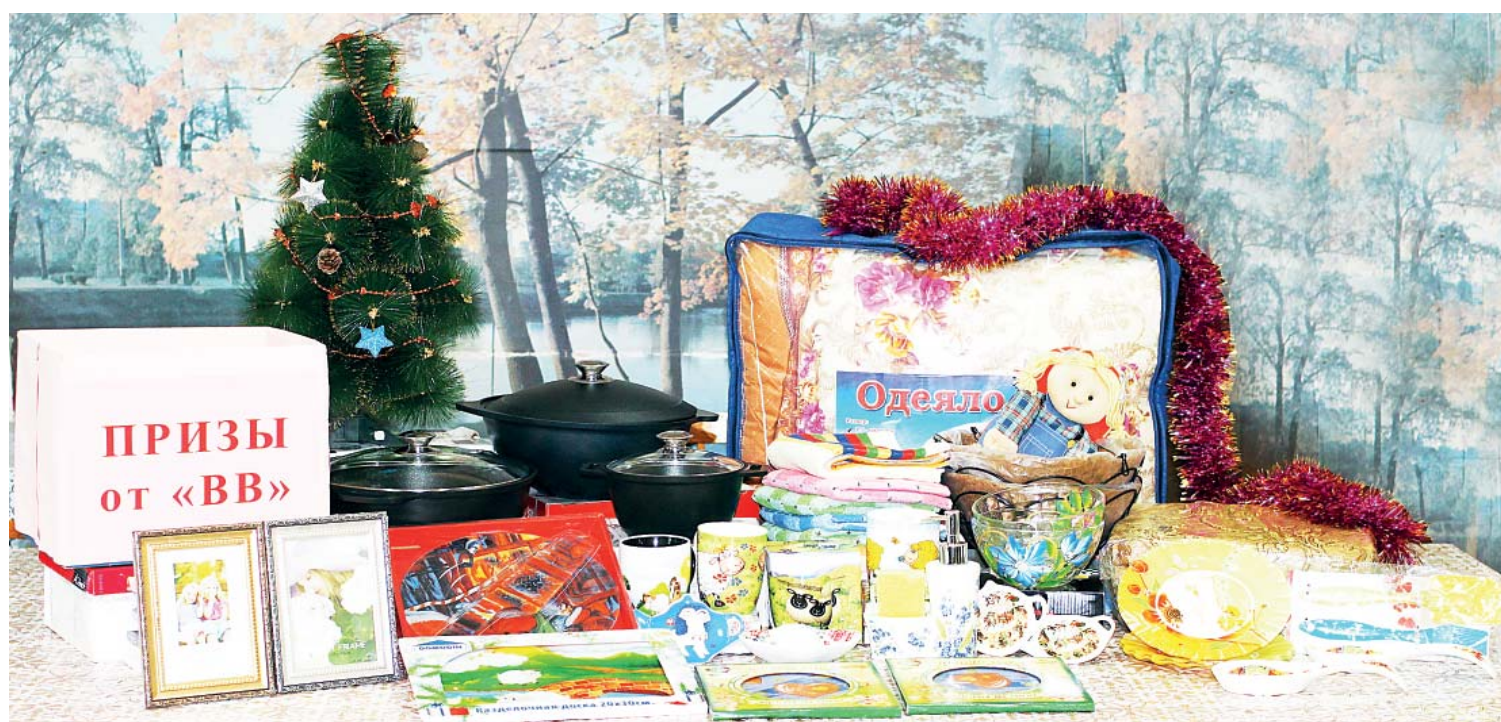
Это еще не всё...