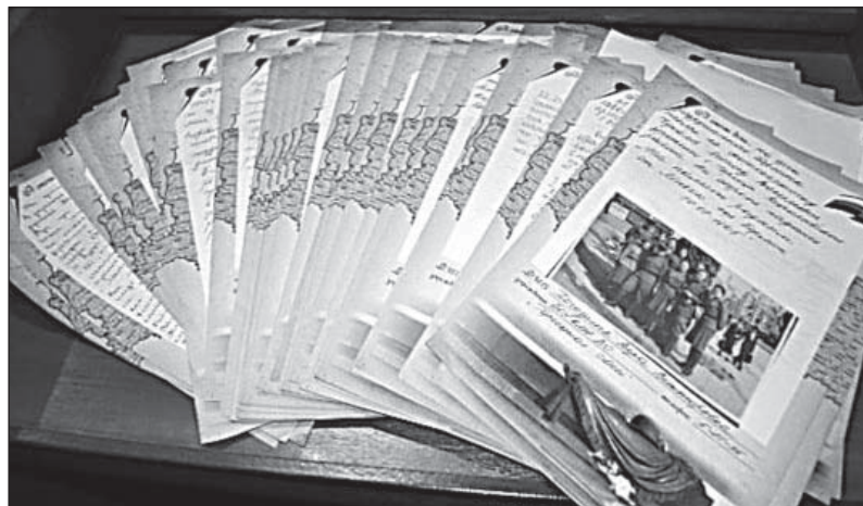
В верховажский «Календарь Победы» вошли воспоминания ветеранов войны, труженников тыла, детей войны, письма с фронта...