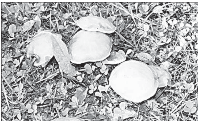
А вот и маслята! Их видно из окна дома.