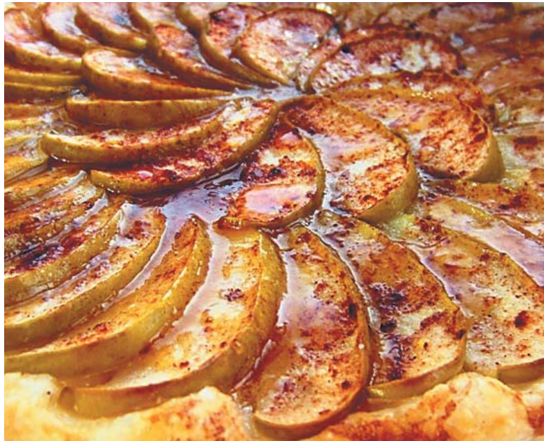
Яблоки — отличная начинка для пирога.

Сверху пирог должен подрумяниться. Готовность можно проверить спичкой или дере-