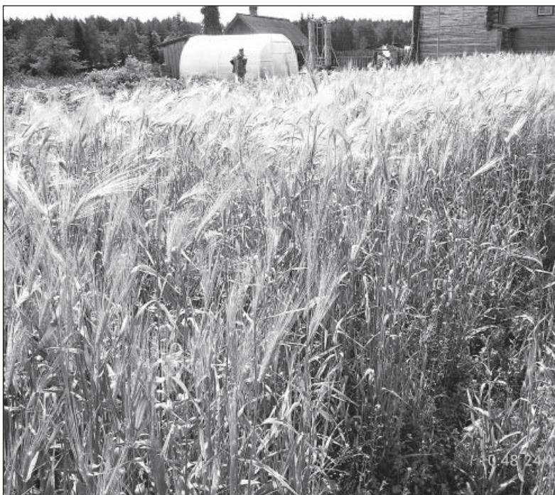
Ячмень уродился на славу: колос крупный — более 40 зерен.

непонятна сила обычной пашни. Одно крохотное зернышко всего за три месяца земля увеличивает в количественном отношении в десятки раз. И такую щедрость она проявляет не только к зерновым культурам. Казалось бы, эти прописные истины общеизвестны. Но мы вспоминаем о них и начинаем размышлять о значении земли, как кормилицы, лишь отвечая на вопросы городского школьника или предвидя грядущую беду.