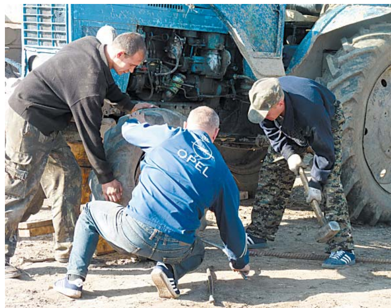
Братья Замятины стараются держаться вместе - так легче даже трактор отремонтировать.