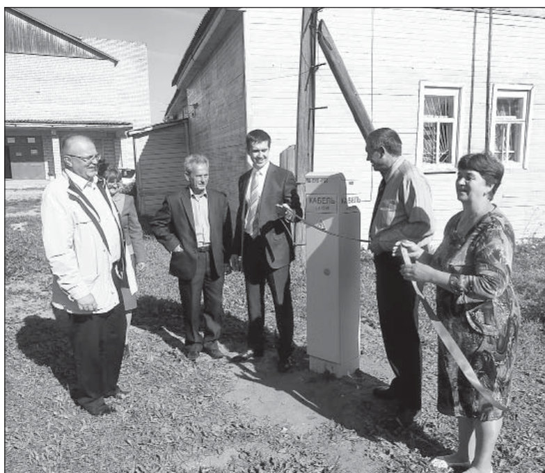
Символическую ленточку на распределительном шкафе перерезали основные участники проекта.

Небольшой экскурс в историю. Частичная телефонизация Куколовской была выполнена в 70-х годах прошлого века – тогда были построены воздушные телефонные линии. В 1987 году в рамках