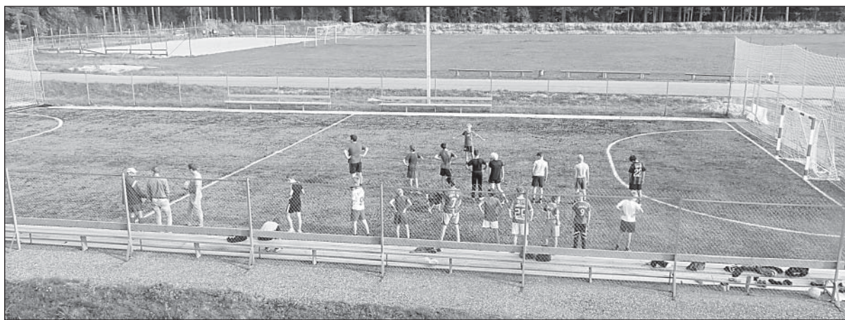
Новая площадка. Вид сверху.