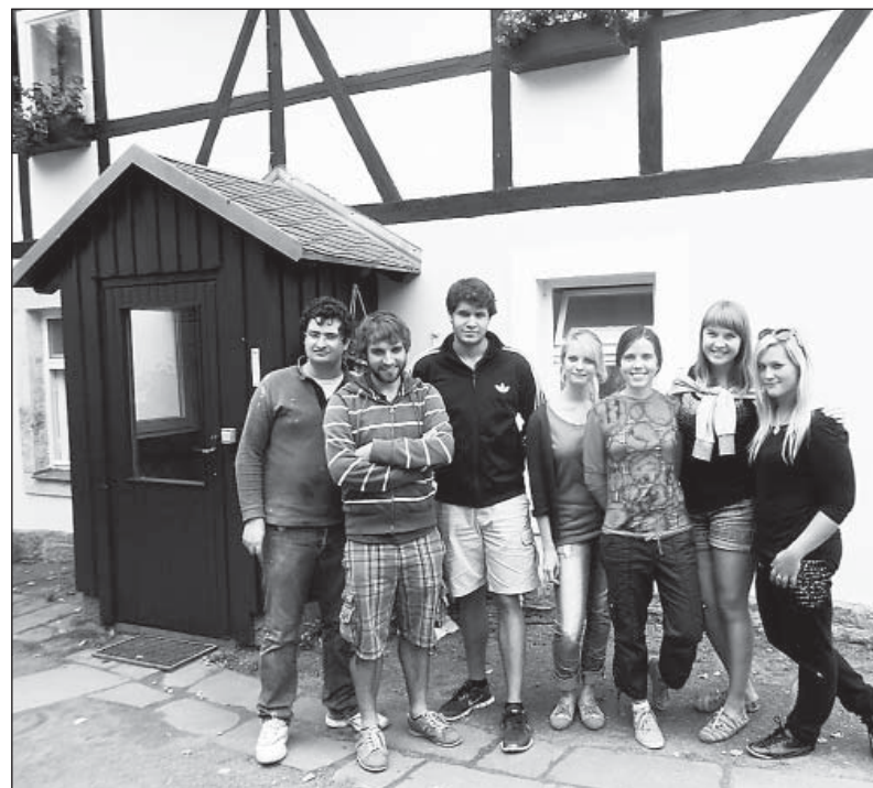
«Наша волонтерская группа на фоне пансионата, где мы работали».