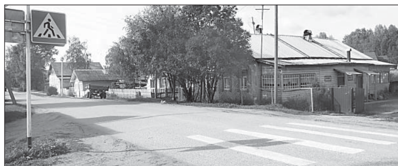
Пешеходный переход — еще не повод не смотреть по сторонам, переходя дорогу.