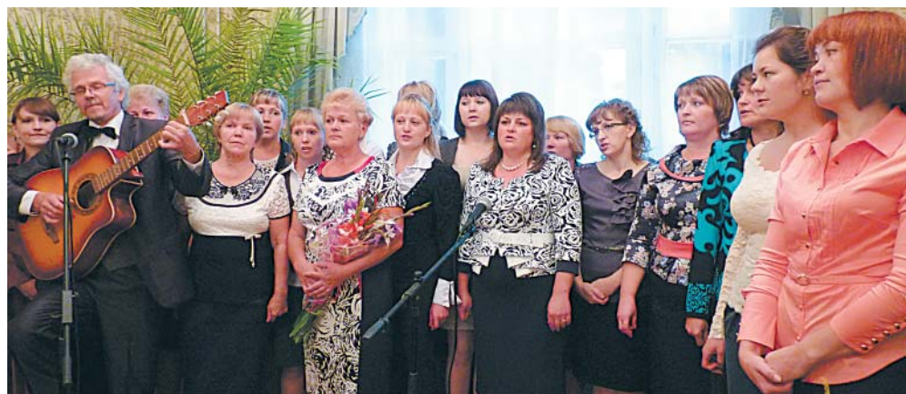
Гимн школы исполняют учителя.