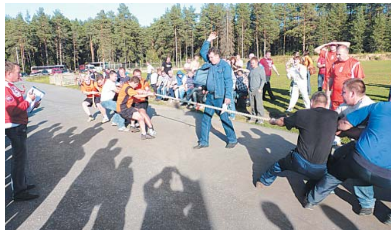
Заключительный этап - перетягивание каната.