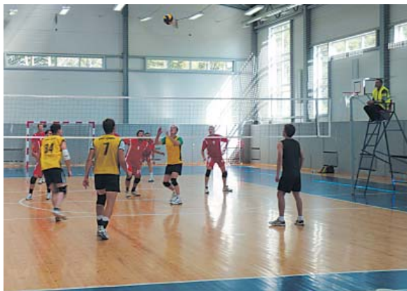
Волейбольный турнир побил все рекорды продолжительности.