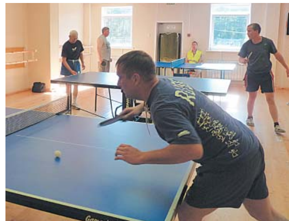
Теннису все возрасты покорны.