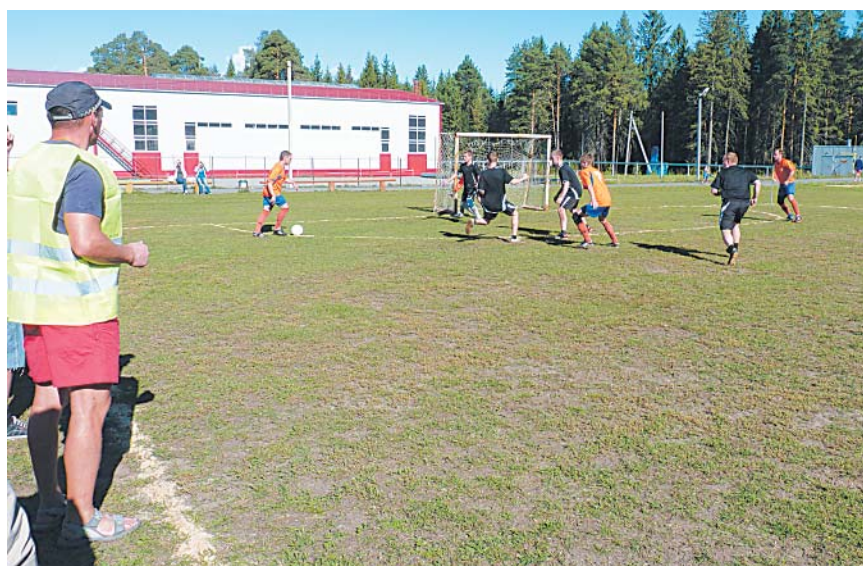
Наибольшее число травм было получено на футбольных площадках.