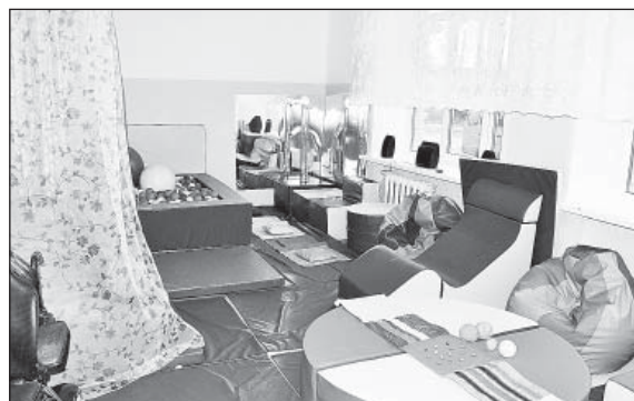
Сенсорный кабинет для детей с ограниченными возможностями