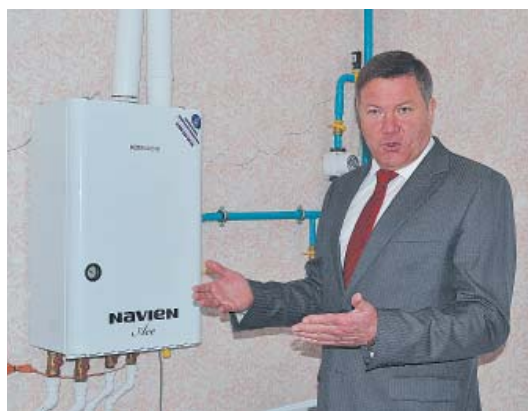
Газовые котлы - отопление удобное