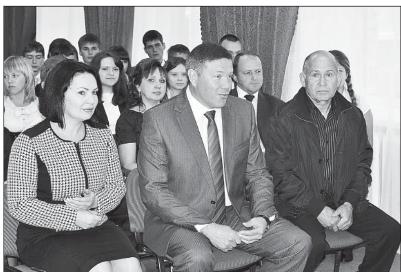
Поздравление с новым учебным годом в режиме онлайн

Глава области принял участие в торжественной линейке по случаю начала нового учебного года, поздравил учащихся, педагогов и родителей с праздником, пожелал успехов в учебе и спорте, серьезно и ответственного отношения к учебе. Он отметил, что именно в школе закладываются основы не только знаний, но и нравственных качеств человека, его активной гражданской позиции. И, конечно, особую роль в этом сложном процессе играют учителя. Губернатор поблагодарил педагогический коллектив за неустанный повседневный труд, выразил надежду, что Верховажская средняя школа, как и прежде, будет готовить настоящих граждан России, патриотов своей малой родины.