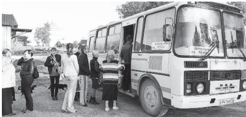
Посадка пассажиров на остановке в Морозово

В полиции не скрывают, что привлечь к ответственности за нелегальный извоз непросто. В первую очередь, из-за необхо-