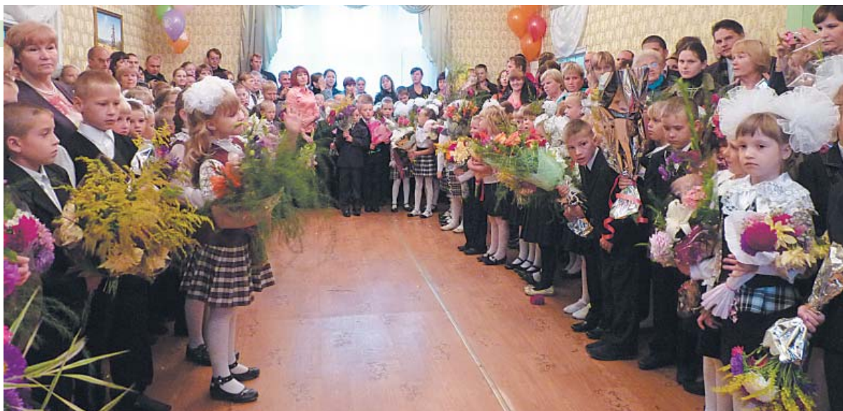
Главное богатство школы - дети.

Наша школа – скромная снаружи, Творческая, умная – внутри! Много лет она народу служит,