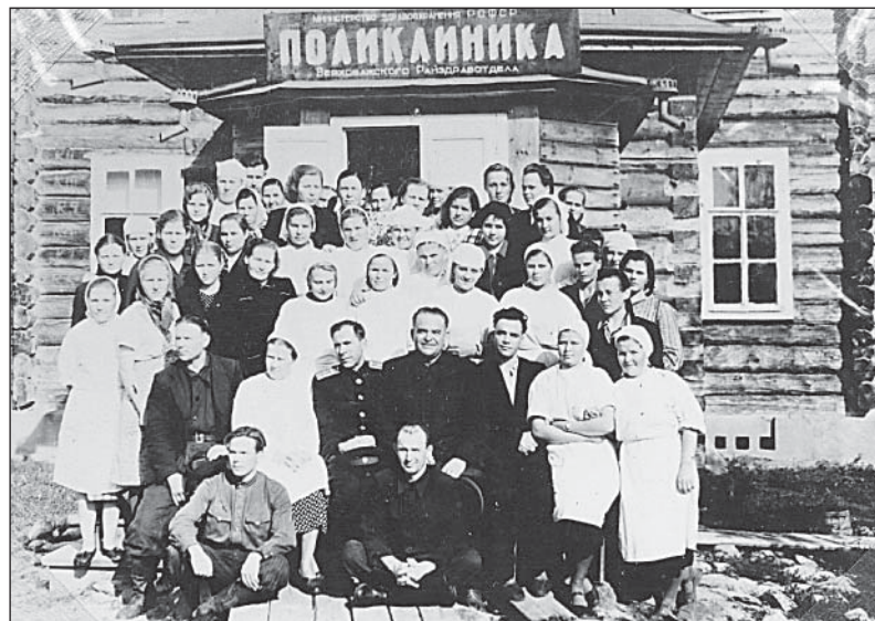
Коллектив Верховажской райбольницы.