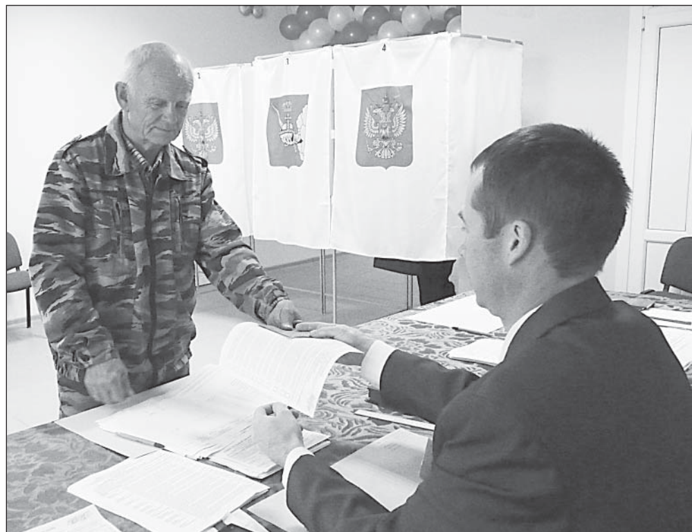
Рабочие моменты на избирательных участках в Верховье и в Верховажье.

На избирательных участках 8 сентября было спокойно и немногочисленно. Погожий солнечный день жители района использовали, чтобы привести в порядок свои огороды: копали картошку, убирали овощи. Многие с утра пораньше отправились в лес.