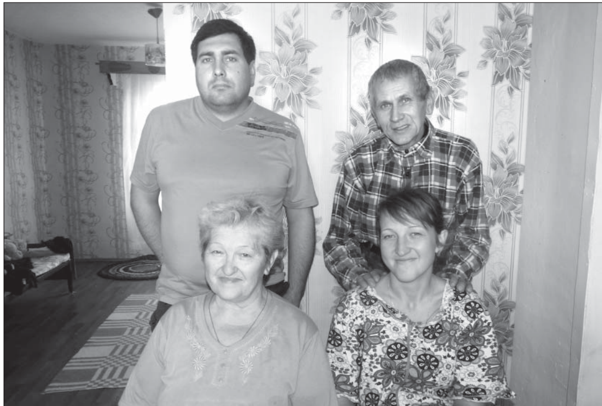
Две семьи живут пока в одном доме

Жили молодые семьи в поселке Желанное Донецкой области. Во время военных