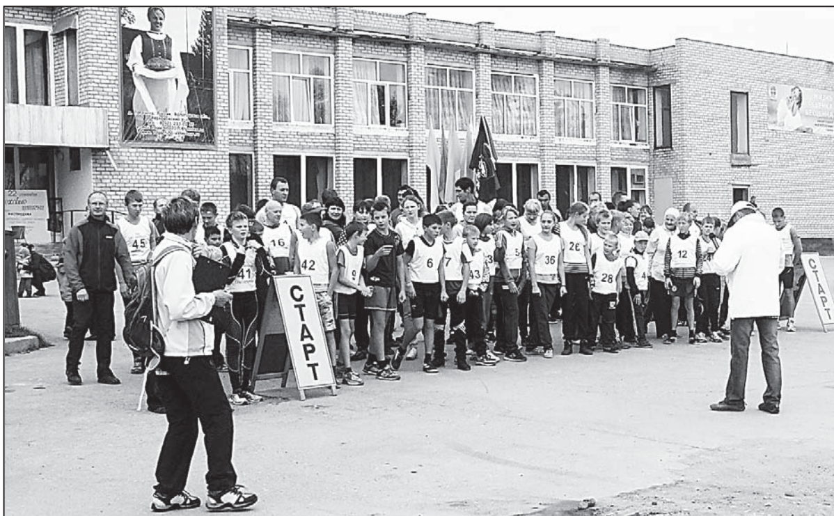
Волнительный миг: последние секунды перед стартом.

Еще один примечательный момент. В день проведения «Кросса наций» прошла