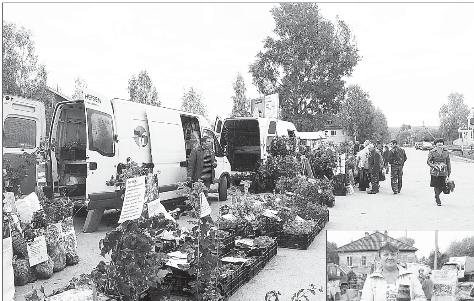
Все цветы хороши - выбирай на вкус!