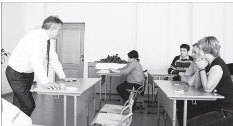
Юные предприниматели Шекснинского района