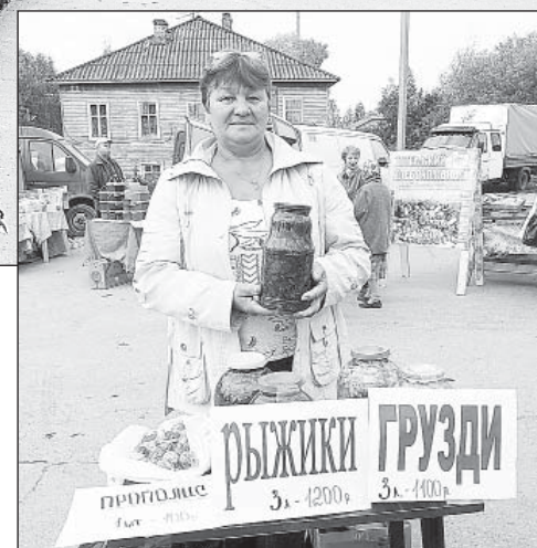
Рыжики и грузди - хороший товар.