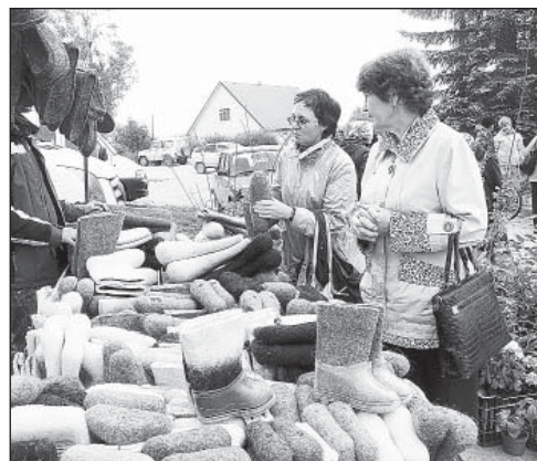
Пора подумать и о валенках...