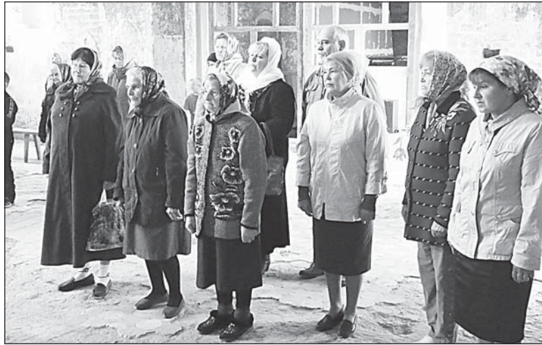
Прихожане храма Воскресения Христова в д. Сметанино.