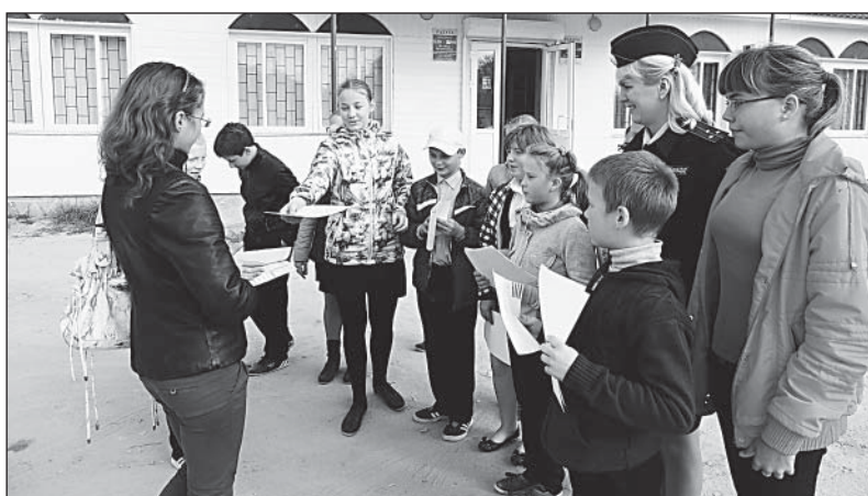
Чушевицкие юидовцы призвали водителей быть внимательнее.