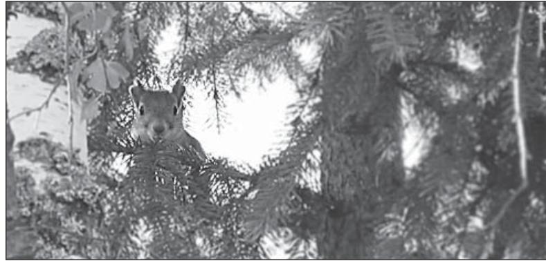
Эту белку сфотографировали рядом с карьером у речки Сивчуга.

- Видимо, это оказалась не полуручная белка, которая в городских парках действи-