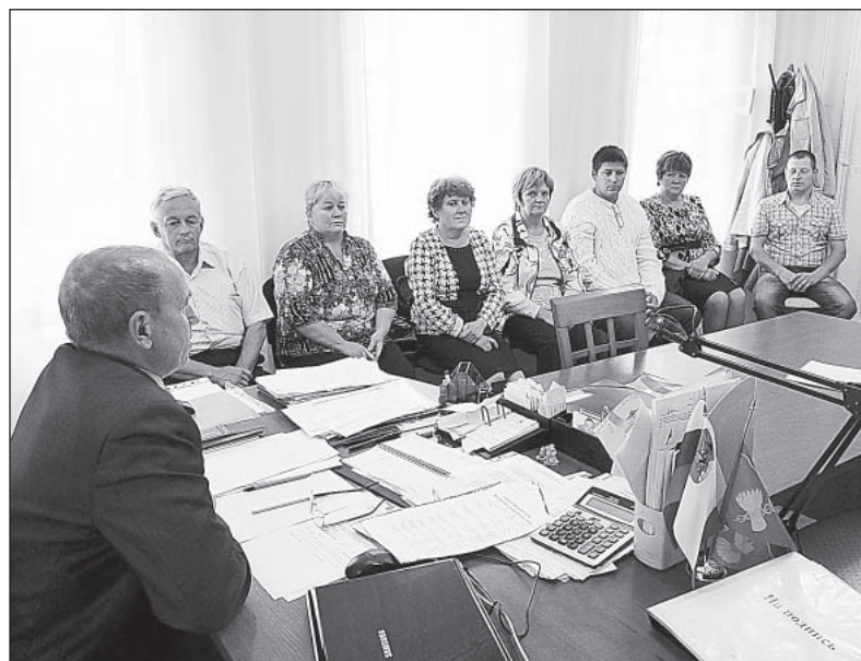
Первое после выборов заседание Совета Верховажского сельского поселения

- Завершить обустройство тротуаров. Чтобы в будущем году, при получении денег из дорожного фонда, заасфальтировать как проезжую часть улицы, так и пешеходные дорожки. Кстати, параллельно удалось отремонтировать и заречную часть улицы Петухова. У «Теплосети» есть теперь карьер, где гравий очень хорош