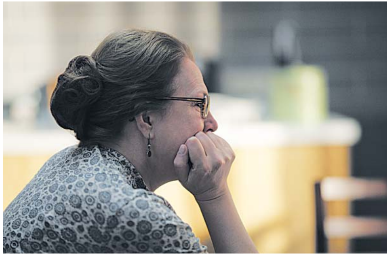
В своей жизни она чаще теряла, чем находила. Может быть, поэтому и не знает, что делать с находкой?