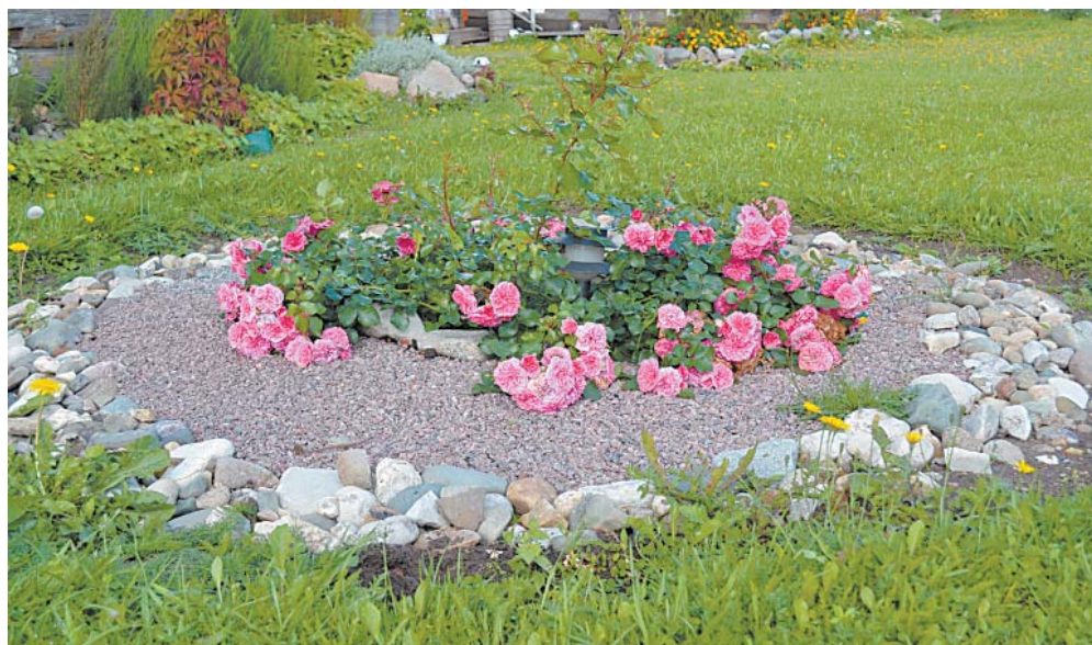
Клумбы в английском стиле во дворе дома Оксаны Рындиной