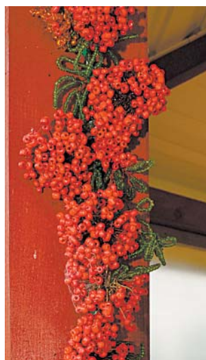
Рябина из бисера в беседке Полежаевых