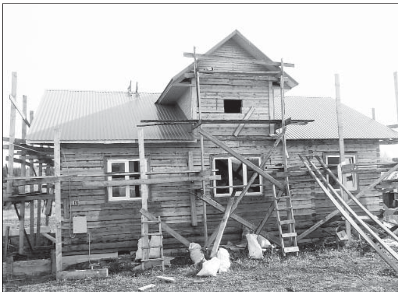
Строящийся по программе дом Юрия Некрасова: «Вот только в летнее время некогда работать на строительстве дома».