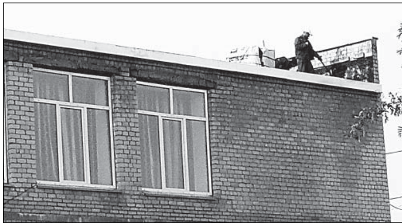
Завершающий «аккорд» ремонта кровли Чушевицкого ДК.

Тазы сейчас убраны за ненадобностью. Сухость в здании