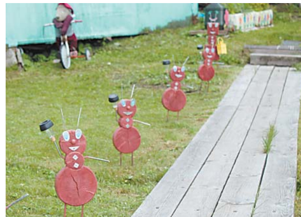
Муравьи с фонариками освещают дорогу к бане темными вечерами на приусадебном участке Салауровых (д. Кукуловская)