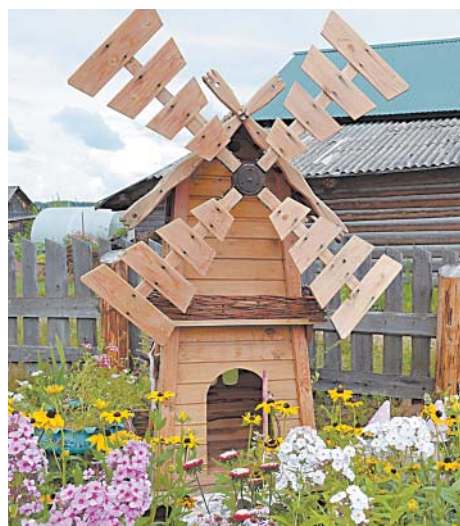
Мини-мельница на приусадебном участке Т.Г. Белоусовой