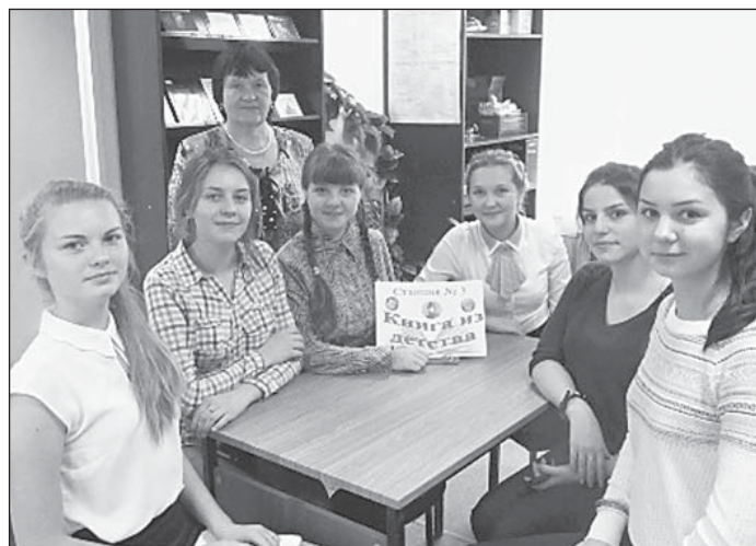
Команда «Знатоки», 9 а класс