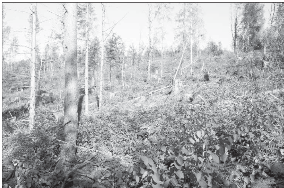
Вырубка в Рагозах над Подсосенским озером (часть древесины тоже не вывезена)

проявляется уважение к земле и настоящий патриотизм?