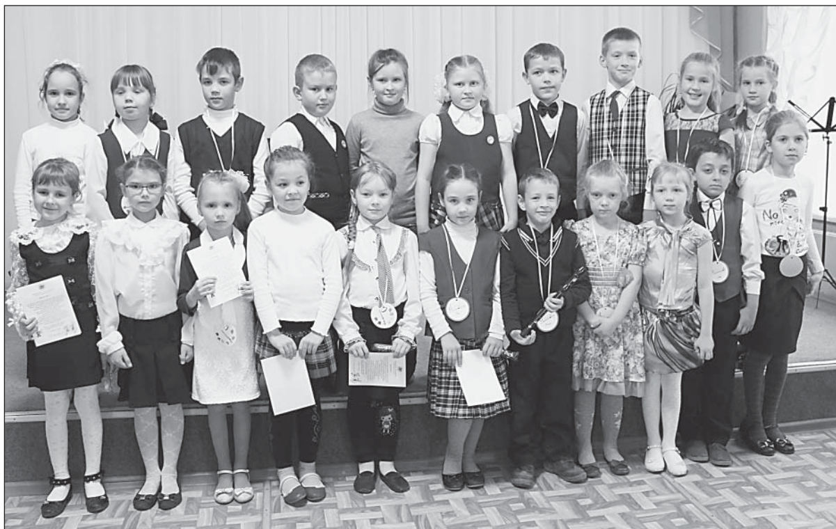
Юные музыканты и художники после посвящения