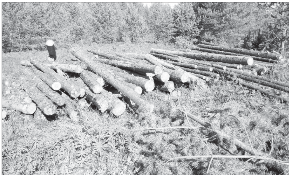
Вырубленные в бору «больные и сухие деревья» до сих пор не вывезены