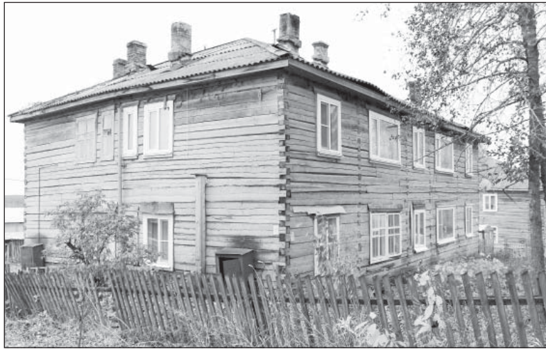
Дома на Смидовича нуждаются в капремонте в первую очередь

тации. Текущий ремонт - смена небольших участков обшивки деревянных наружных стен, частичная смена отдельных элементов перекрытий, смена и восстановление отдельных элементов оконных и дверных заполнений, замена, восстановление отдельных участков полов, восстановление или замена отдельных участков и элементов лестниц, балконов, крылец, восстановление отделки стен, потолков, полов отдельными участками в подъездах, технических помещениях, в других общедомовых вспомогательных помещениях и так далее. Список большой. Но главное понятно: текущий ремонт не подразумевает каких-то фундаментальных работ. Это входит в функции капитального ремонта. Поэтому мы вынуждены отказывать людям: пытаюсь заменить две-три шиферинки на протекающей крыше, ремонтники неизбежно нарушат сильно обветшавшие