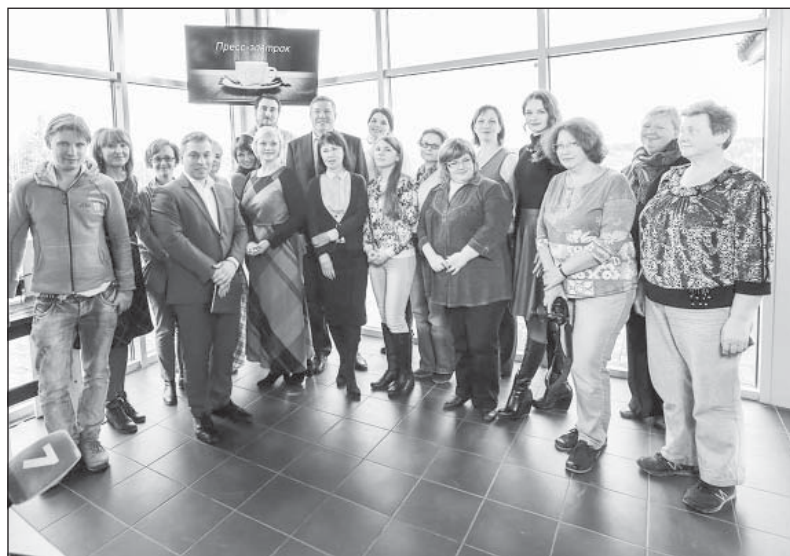
Губернатор Вологодской области О.А. Кувшинников во время пресс-завтрака с журналистами

Опубликовано в соответствии с Договором на оказание услуг по распространению информационно-аналитических материалов о деятельности органов исполнительной государственной власти ВО