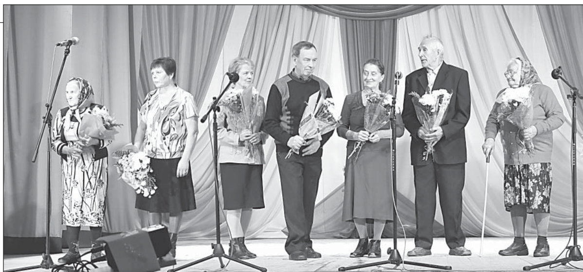
Ветераны, отпраздновавшие в этом году юбилейные дни рождения