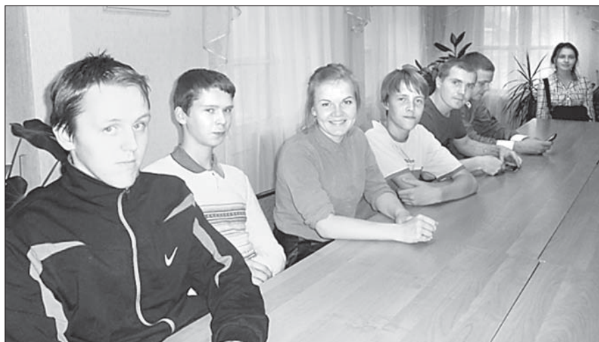
Победители игры — команда Тотемского колледжа