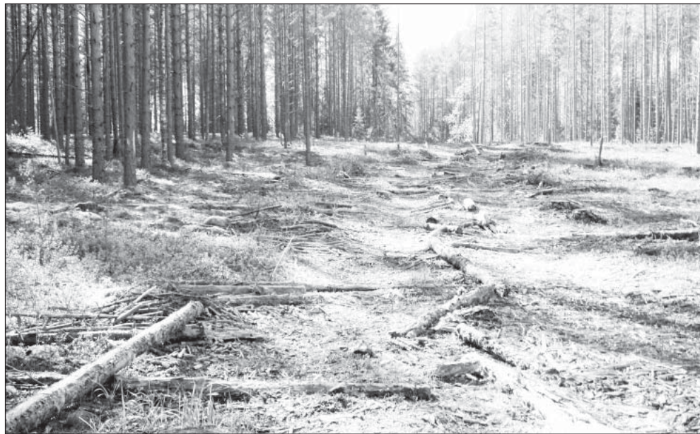
Подсосенский бор после рубки «ухода»

Знают ли читатели «ВВ», сколько изранено по-хозяйски обработанных полей в СПК колхозе «Липки»? Неужели лесники не понимают, что творят? В каких недрах души зарождается такое безразличие к результатам труда работников сельского хозяйства? В отличие от лесорубов, они ежегодно пашут, сеют и выращивают урожай сами, своими силами. Не в этом ли