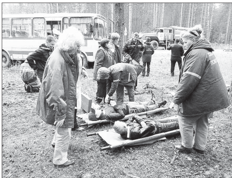
Ликвидация последствий ДТП с участием автобуса и легкового автомобиля. Медики ЦРБ оказывают первую помощь.