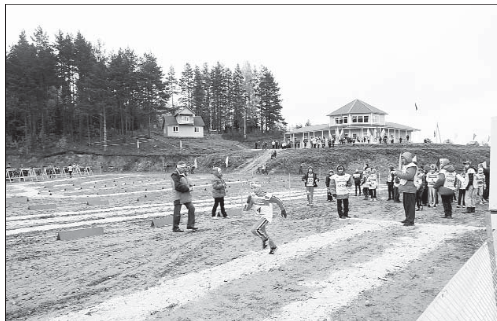
Начало старта участников.