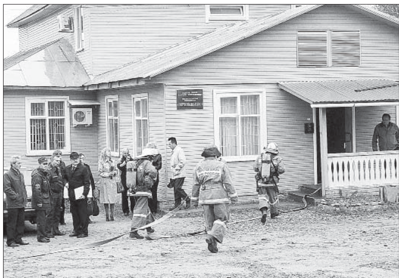
Прибытие пожарного расчета на тушение учебного загорания в офисе ООО «Верховажьелес».

На прошлой неделе в районе прошли масштабные двухдневные командно-штабные учения с органами управления районного звена ГО ЧС. «Экзамен» у местных властей и экстренных служб принимала комиссия ГУ МЧС России по Вологодской области.