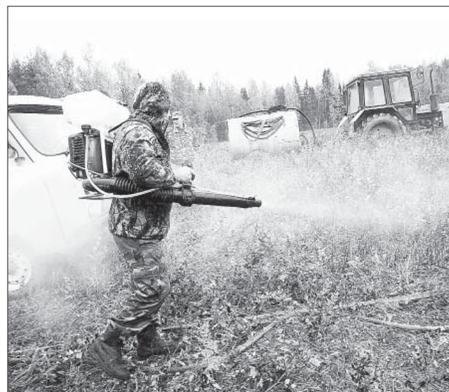
Тушение условного лесного пожара в районе деревни Рогачиха. На первом плане – лесной пожарный с воздуходувкой – компрессором низкого давления, на втором плане – водораздатчик.