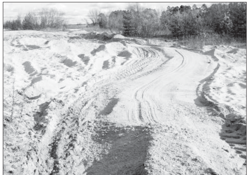
На пляже образовался несанкционированный карьер

Жить по закону Проект редакции при поддержке Управления информационной политики правительства Вологодской области