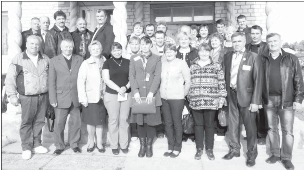
Участники совещания в СПК колхозе «Н-Кулое»

Заметные подвижки в животноводстве и растениеводстве — результат знаний на семинарах и использования опыта передовых технологий из хозяйств Вологодского, Грязовецкого, Тотемского районов, а также Калужской, Архангельской, Ярославской областей. А также приглашения в район специалистов по кормлению и содержанию молочного скота