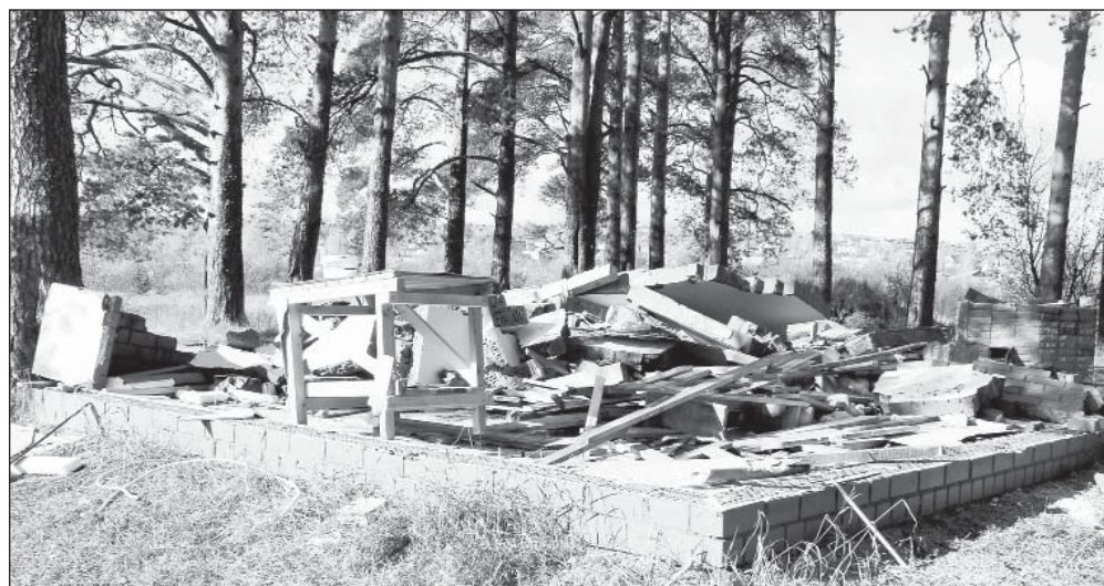
Незаконные строения в Пестерёвской роще разбираются