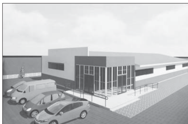
Такое здание в ближайшее время появится на площади рядом с Домом культуры

Нужно сказать, что общественная комиссия по сохранению исторического облика села занимается не только вопросами соответ-