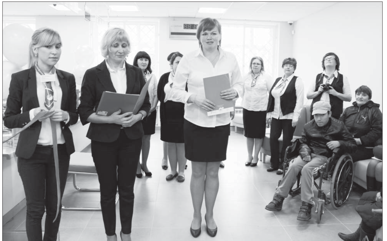
Коллектив Сбербанка приветствует своих клиентов в обновленном помещении

Подготовили Владимир Басов, Ольга Гулина