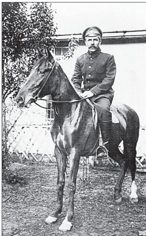
Во время военной службы.