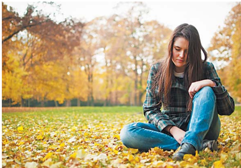
Виды осенней природы навевают грусть.

А человеку чувствительно, который считает, что осенью природа умирает, следует просто подумать о том, что весной она снова оживет и круговорот времен года — это бессмертие природы. Как когда-то писал Козьма Прутков: «Вянет лист. Проходит лето. Иней серебрится... Юнкер Шмидт из пистолета хочет