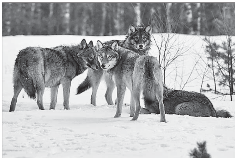
Популяцию волков необходимо держать «в узде».

Волк же, вне всякого сомнения, достойный противник. Смелый, умный и хитрый. И, как уверены опытные охотники, чем взрослее, тем хитрее. Инстинкт самосохранения развит необычайно, плюс приобретенный жизненный опыт. Иначе