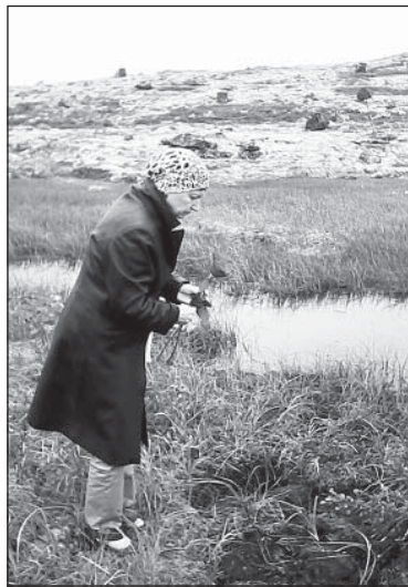
Цветы от внучки Надежды...