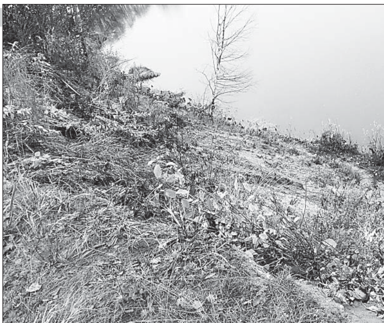
Огородные отходы сбрасывают под кручу.

- Но ведь согласны, что выбрасывать где попало ого-