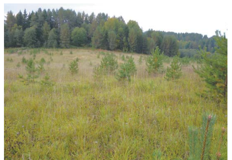
Зарастающее лесом поле. Сентябрь 2013 года.

В 1960-1970-е годы государство выделяло огромные деньги на нужды сельского хозяйства СССР. В том числе на расширение посевных площадей, улучшение плодородия пашен, сенокосов и пастбищ. Просторные, в сотни гектаров поля Вологодской области были разработаны именно в те десятилетия. К нашему стыду и великой горести крестьянина