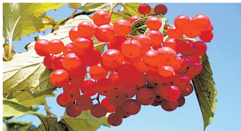
Ягоды калины — кладезь полезных веществ.

щей, зелени. Сейчас осень, и нехватки в этом вроде бы нет. Но посмотрите, какие фрукты в основном на наших столах: груши, апельсины, мандарины, бананы; появились заморские плоды — кокос, манго, папайя. Много ли витаминов и полезных веществ сохраняется в них, приземных издалека? А ведь в этом году нам грех жаловаться на свой урожай.