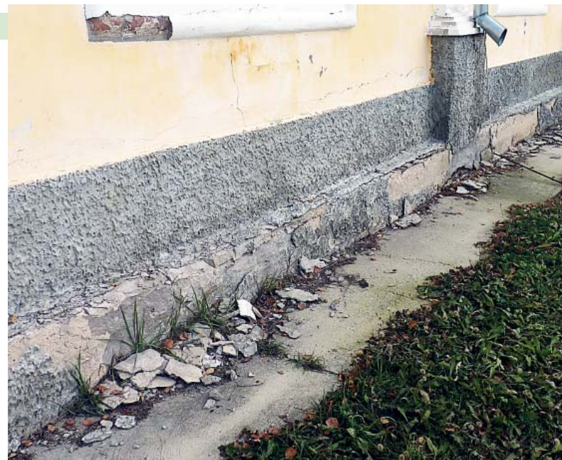
Это только разрушения, видимые глазу снаружи.

Первоочередные рекомендуемые мероприятия члены попечительского совета рассчитывают выполнить за счет проведения субботников при участии добровольцев из числа прихожан и неравнодушных людей. Это приведение в порядок водостоков и отмостки, понижение, если потребуется, земляного слоя до бутового камня. Дальнейшее требует вмешательства специалистов и серьезных финансовых вложений. Поскольку планируется