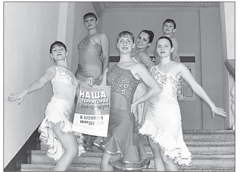
21 октября взрослая группа коллектива приняла участие в зональном этапе «Нашей территории». Станет ли «Комильфо» участником гала-концерта — читайте в следующих номерах «ВВ».

- В большом зале спортшколы совсем нет музыкальной аппаратуры. Приходится привозить на каждое занятие личную технику, а тут еще и колонки сломались. Так что если у кого-то из читателей есть неиспользуемые, но исправные, будем рады принять их в дар. Это об острых нуждах. В целом, не помешал бы большой зал с хорошим полом, оборудован-