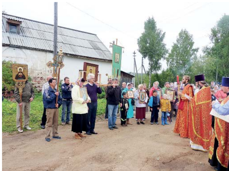
Крестный ход 7 сентября в память о великомученице Варваре.