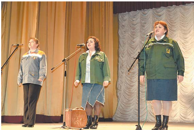
Ансамбль «Мелодия» из Чушевиц с песней «Мой адрес — Советский Союз».