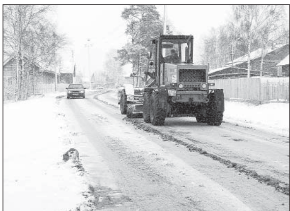
Первый снег, выпавший 15 октября, заставил выйти на улицы снегоуборочную технику.

Количество ДТП снизилось более чем вдвое