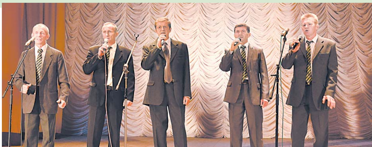
Мужской ансамбль «Воскресение» из Сметанина.

Наталья Свирская