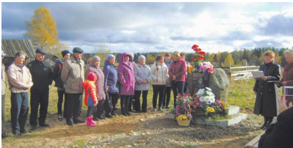
На открытии памятного знака в д. Михалево Шелотского сельского поселения.