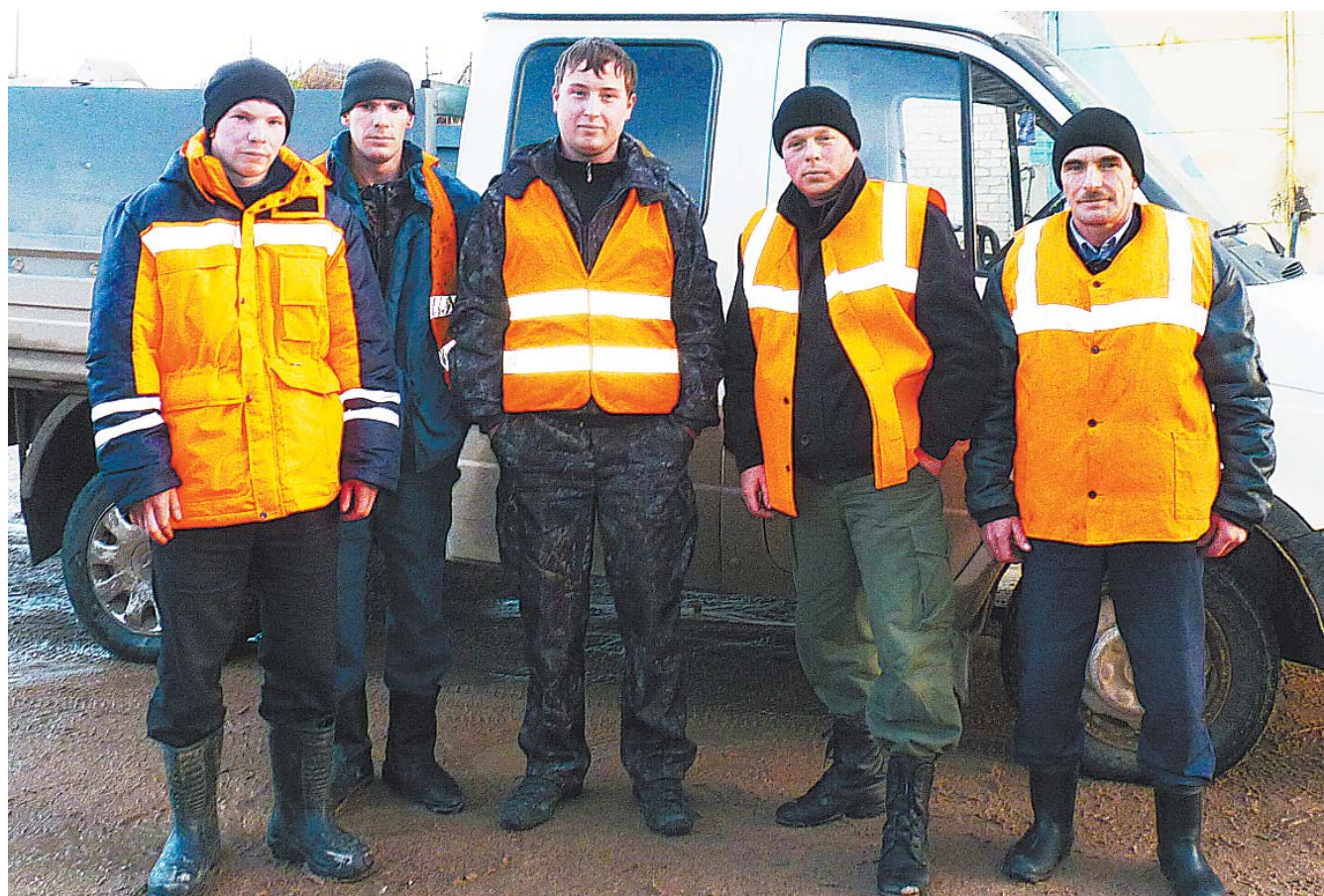
Бригада, которая отремонтировала мост через реку Сивчугу.

20 октября - День работников дорожного хозяйства