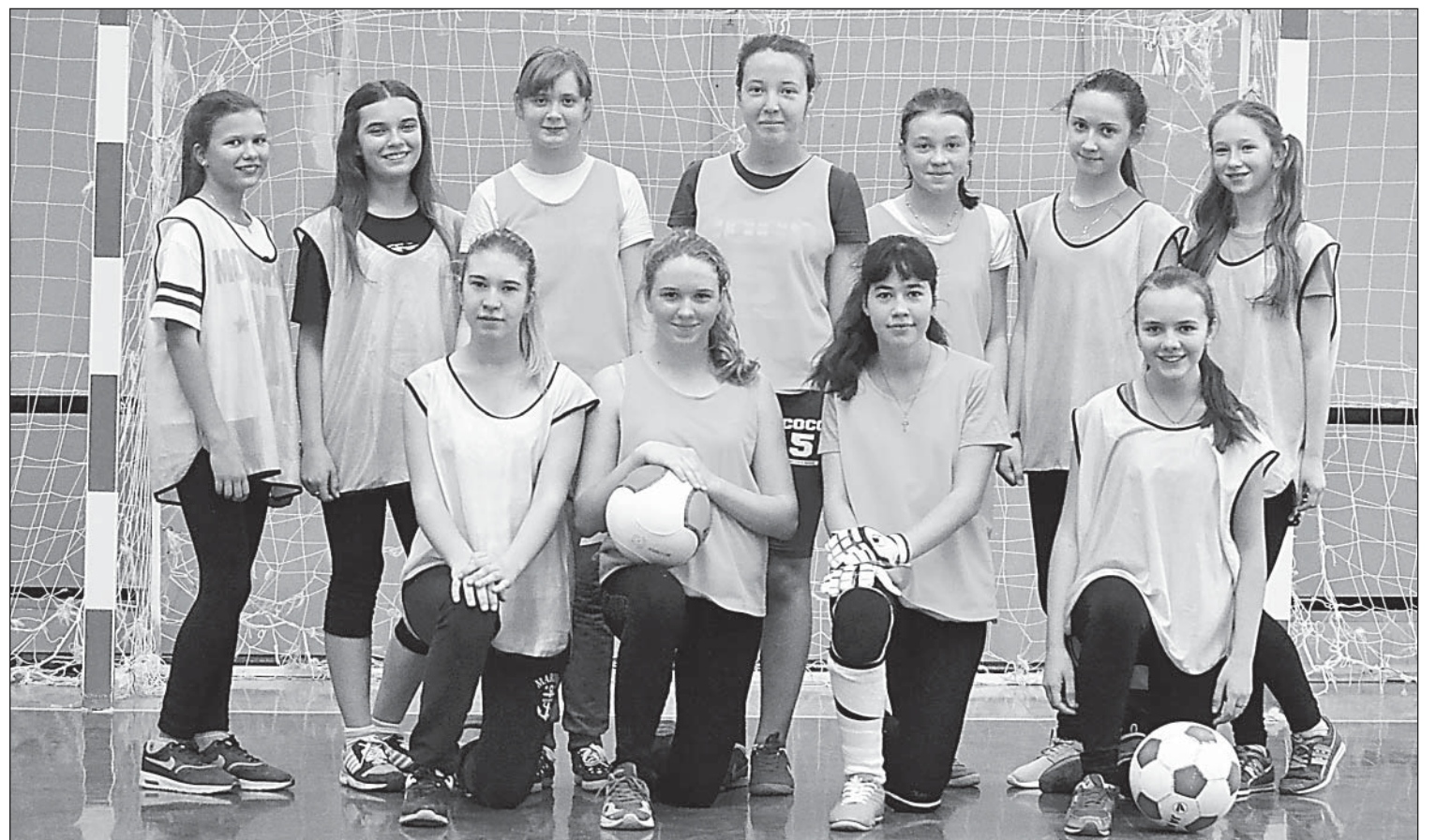
Футбол среди девушек становится популярным

Подготовили Владимир Басов, Наталья Соломатова, Ольга Гулина