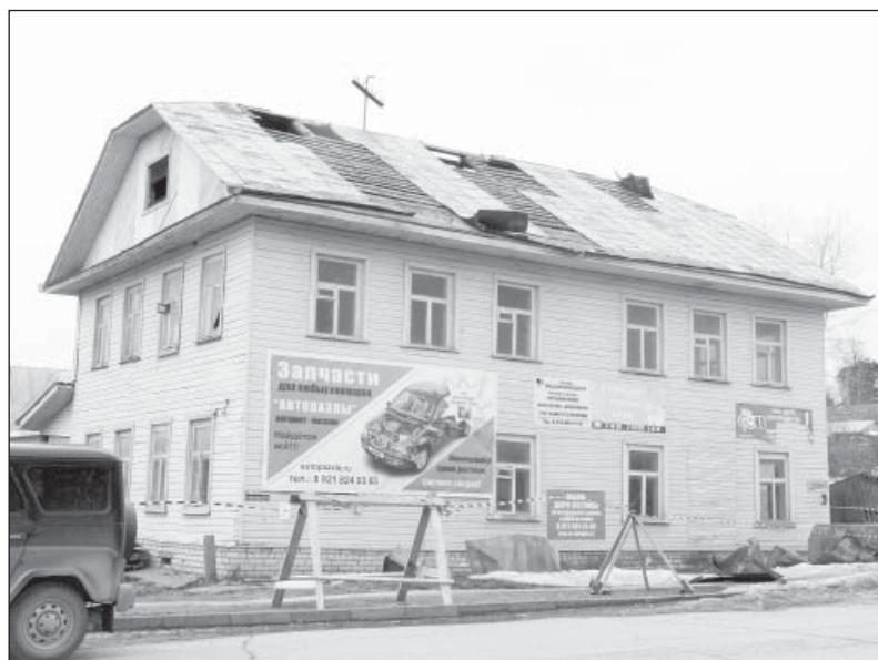
Менее, чем за полгода на месте старого деревянного здания райпо (на нижнем снимке) появилось современное двухэтажное

ценны - не веская причина взять товар. Особенно, когда есть вариант купить его гораздо выгоднее. Например, в соседнем Вельском районе, где есть и «Магнит», и «Пятерочка». В поиске менее «кусачущихся» цен многие жители района уже давно ездят туда за покупками.