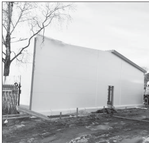
Супермаркет «Магнит» откроется в центре Верховажья

Мы спросили верховажан о том, как они относятся к появлению новых магазинов у нас в селе. Вот что они ответили: