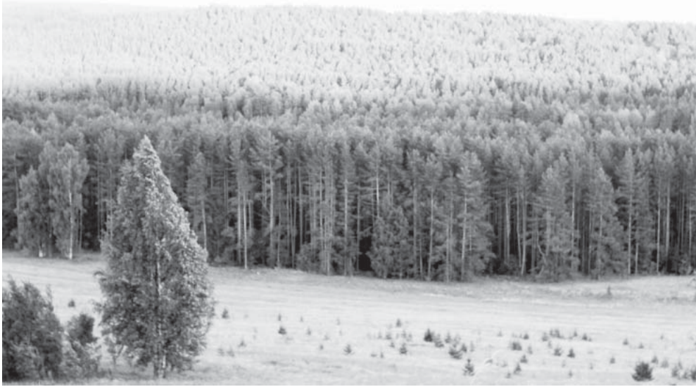
Главное природное богатство нашего района — лес