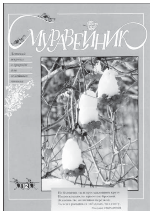
Первая страница одного из номеров журнала «Муравейник»

«Продажа лесов в частную собственность лишает людей свободно-