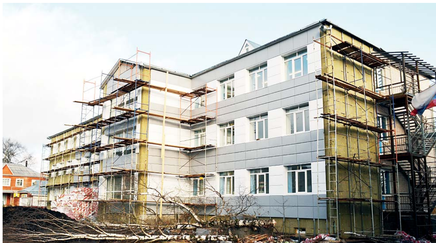
Здание бывшего профессионального училища преобразуется на глазах.