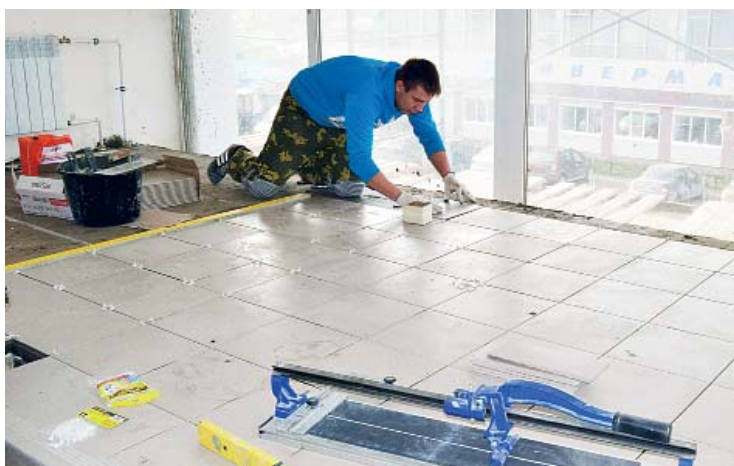
Укладка плитки на лестничной площадке между вторым и третьим этажами.