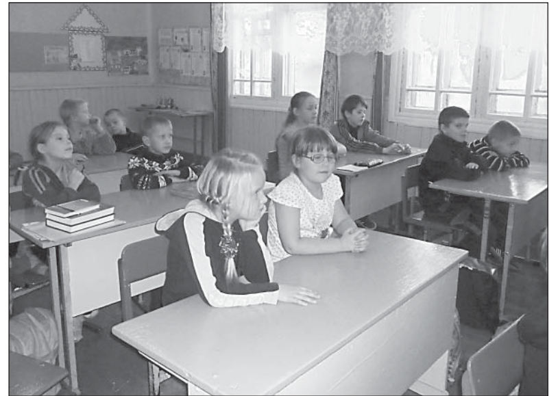
Деревенские младшие школьники ничуть не уступают в развитии своим городским сверстникам. В этом убедился автор на встрече с липецкими ребятами прошлой осенью.

Мы в этом возрасте не были такими умными и развиты-