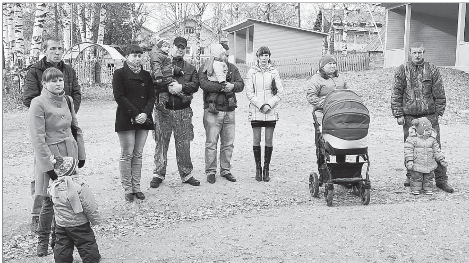
На открытии детского сада присутствовали родители воспитанников.