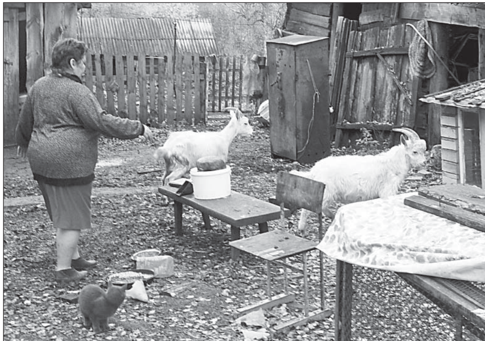
Козы борщевика не боятся.