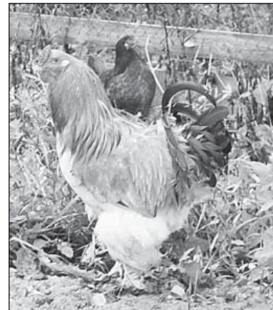
Петух — ранний «будильник».