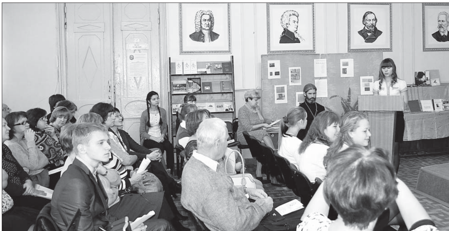
Научно-практическая конференция «Геокультурные аспекты изучения Важского края» прошла в Школе искусств.