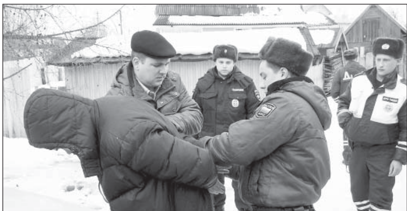
Задержание условного преступника на улице Стебенева во время областных учений в марте 2014 года

За девять месяцев выявлено всего четыре нарушения.