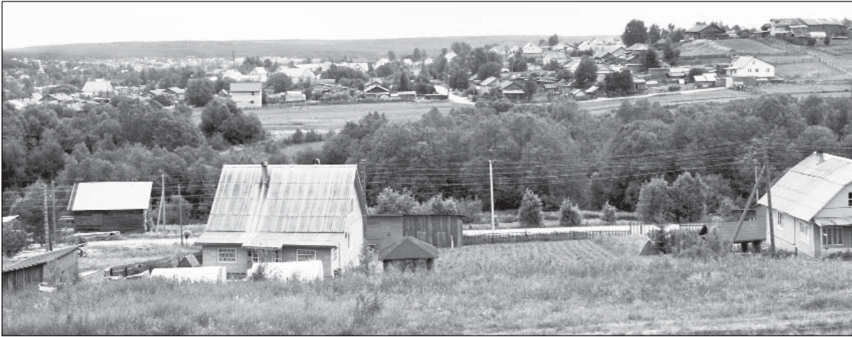
Вид на Наумиху с деревни Высокое