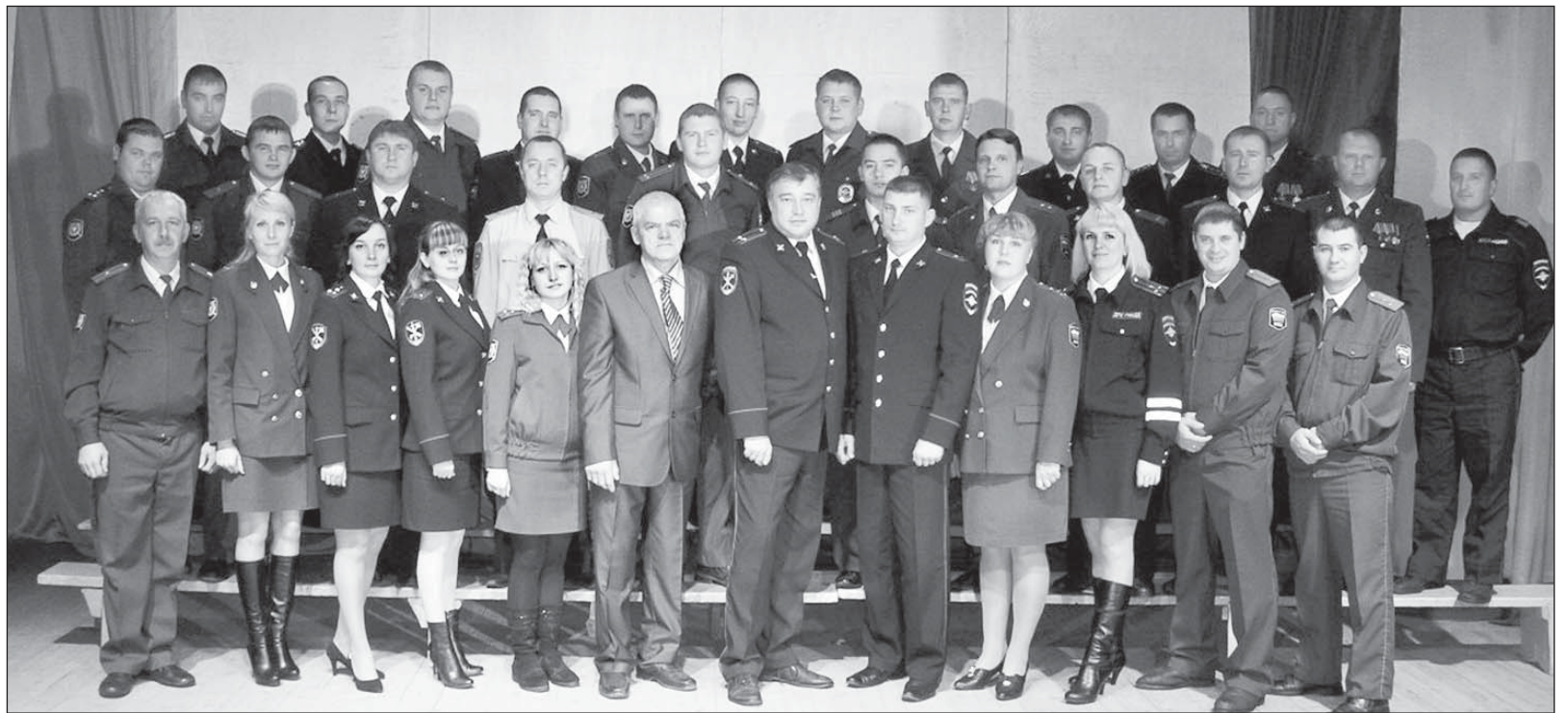
Коллектив сотрудников МО МВД России «Верховажский» 10 ноября 2014 года

Если обратиться к статистике, то большее число правонарушений совершают неработающие и ранее судимые граждане. По количеству преступлений лидируют Верховажское, Чушевицкое, Климушинское и