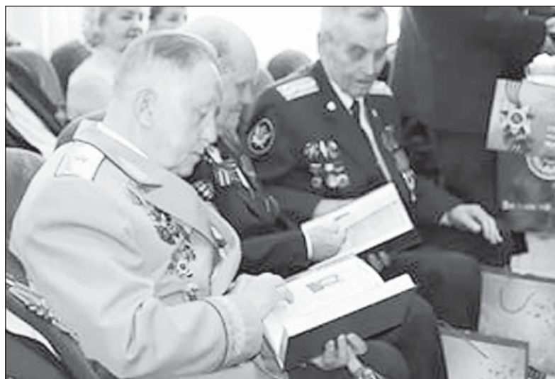
На презентации книги «На защите Отечества и правопорядка» в областном УМВД. Книга посвящена ветеранам и труженикам тыла Великой Отечественной войны, служившим в органах внутренних дел Вологодчины.