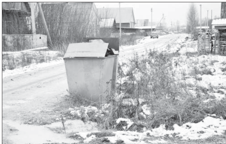
Контейнеры в микрорайоне Черемушки установлены еще летом

Владимир БАСОВ.