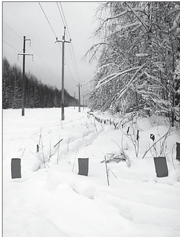
Протяженность оклада достигает 6 км.