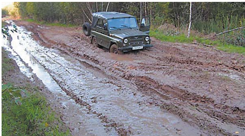
Совсем недавно такие дороги в нашем районе были не редкостью.