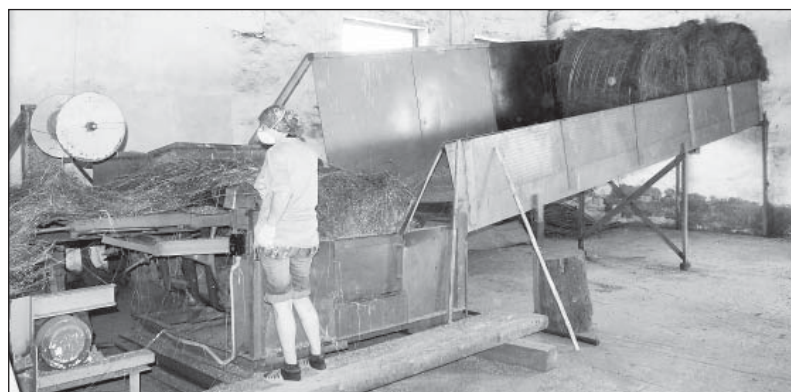
В цеху льнозавода.