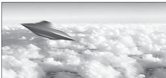
Это фото из интернета скорее всего является фотомонтажом. Но кто знает, может, когда-нибудь мы опубликуем и снимок реальной «летающей тарелки»?