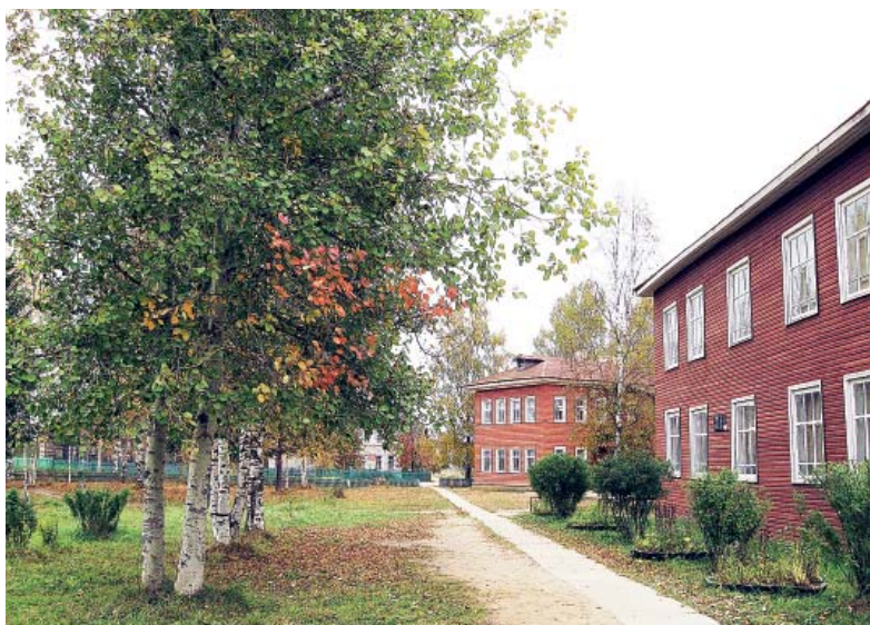
Здания Чушевицкой средней школы.