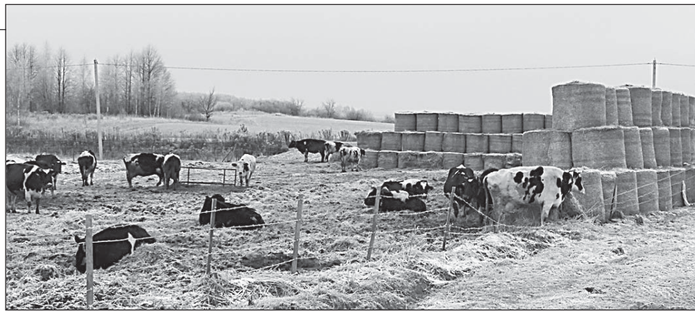
В хозяйстве А. Саяпина (Калужская область) телят содержат на улице

Что касается содержания коров на улице, то мы неоднократно рассказывали об опыте, перенятом в прошлом году в Калуге. Там коровы круглогодично находятся вне помещения, на глубо-