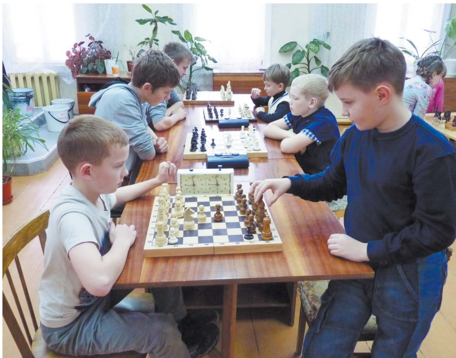
Старт соревнований: первые шахматные фигуры «пошли в бой»...

Подготовили Владимир Басов, Ольга Гулина, Наталья Соломатова