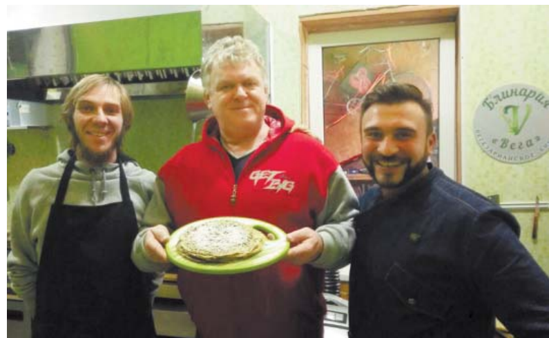
С приятелями в блиннице «Вега»