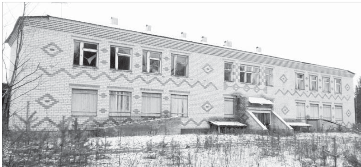
Бывший детский сад. в д. Плосково. Было время, когда в наших деревнях строили такие социальные объекты....

«Требования о приведении здания в состояние, пригодное для эксплуатации, не могут быть удовлетворены по следующим основаниям. СПК (колхоз) «Россия» в настоящее время не является ни собственником, ни арендатором, не состоит ни в каких договорных отноше-