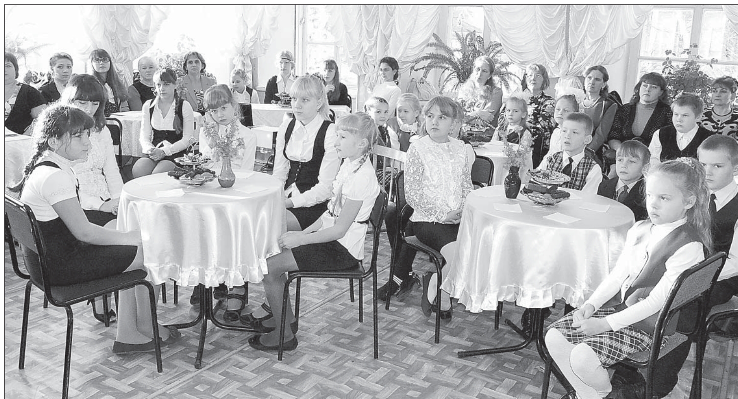
Конкурс проходил в форме салона в концертном зале Школы искусств.