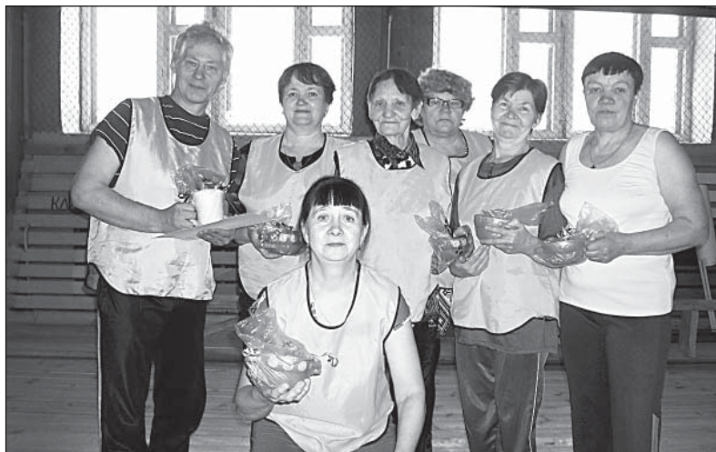
Ветераны из Климушина с заслуженными призами