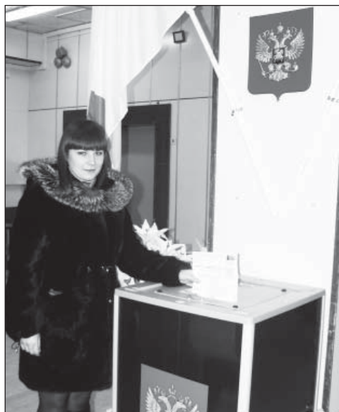
Федеральный закон №136-ФЗ существенно изменил принципы организации местного самоуправления: теперь нам предстоит выбирать только депутатов сельских поселений.

В настоящее время глава муниципального образования, фактически обремененный всеми полномочиями и обязанностями сразу, в одиночку с трудом справляется с возложенными на него функциями. Вот почему предлагается возложить ответственность за текущую деятельность на плечи руководителя районной администрации, «сити-менеджера», назначаемого по контракту. Одним словом, кроме дол-