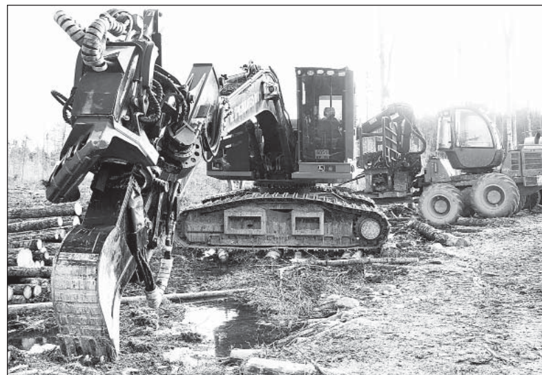
Лесозаготовительные комплексы работают практически повсеместно.

Впрочем, по отдельным крупным арендаторам ситуация не столь однозначная. Примерно на 10 тысяч кубов