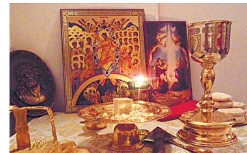
В отремонтированной церкви Воскресения отпраздновали Рождество