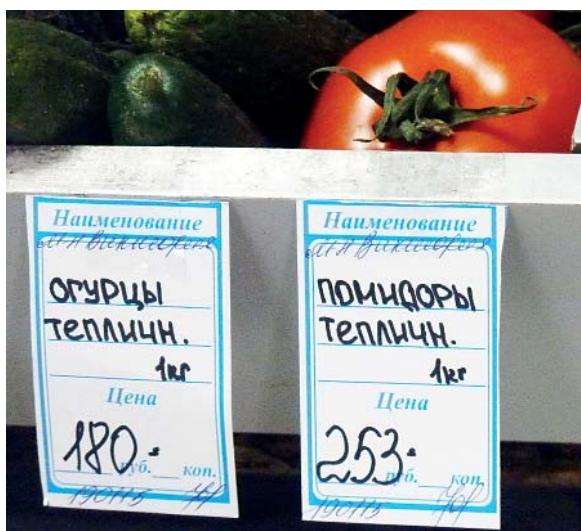
Магазин ЗАО «Верховажьелесторг» п. Теплый Ручей.

«Нет», потому что на прилавках магазинов есть колбаса стоимостью чуть выше 100 рублей за 400-граммовую упаковку, крупы, рыбные консервы, растительное масло, хлеб, молоко подорожали не более, чем на 30 процентов, что вполне «вписывается» в требования прокурорской проверки.