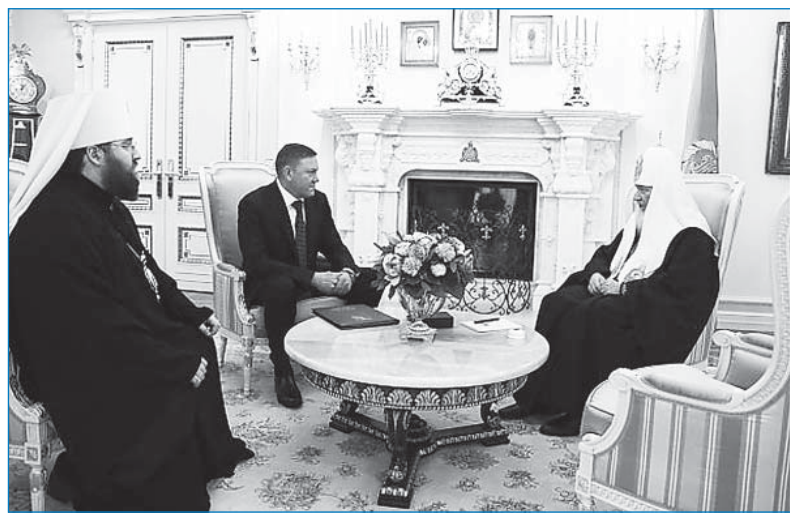
На встрече с Патриархом Кириллом.