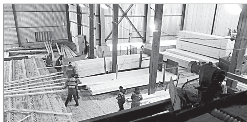
На сортировке готовой продукции

нуле 30 миллионов тонн в год, доля России в этих объемах всего миллион тонн.