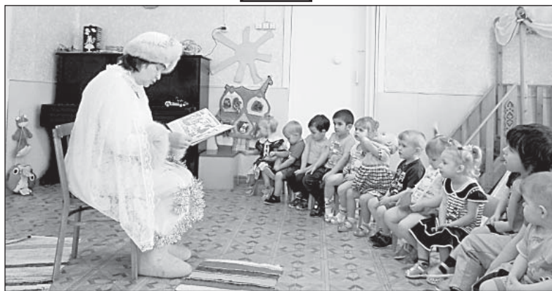
Любовь к чтению маленьким жителям Чушевиц прививают с детства