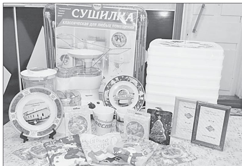
50 призов Новогоднего розыгрыша от «ВВ» ждут своих обладателей в редакции