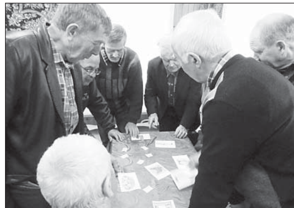
В игре «Моя Вологодчина» членам клуба «Надежда» равных не было.

теке, читая газетные подшивки разных лет, прочую литературу».