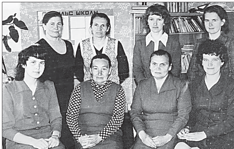
Коллектив учителей в 1975 году.

Школа... Это слово отзывается светлым чувством в душе каждого... Школа в нашей памяти — это светлые классы, исписанная мелом доска, потерянный где-то дневник, первая влюбленность, строгие учителя, родительские нотации... А как здорово звенел школьный звонок с последнего урока. Книжки летели в портфель, как птицы. Школьный двор оглашался радостными криками. И так из года в год... А для Олюшинской школы уже 105 лет!