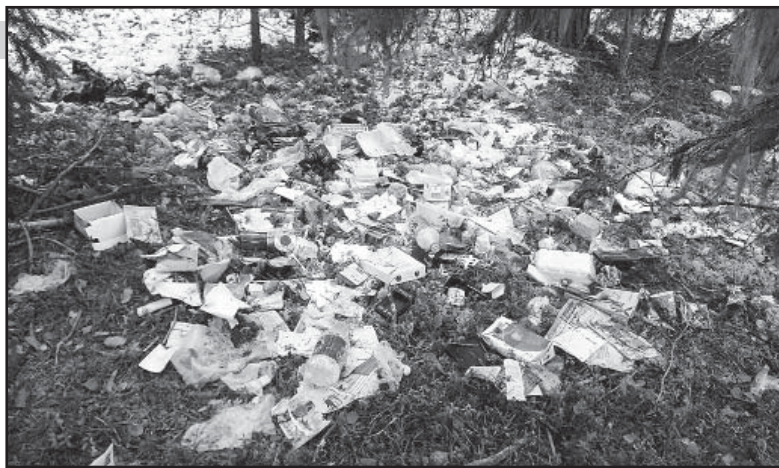
Верховажский мусор в коленьгском бору.

У читателя возникнет закономерный вопрос: в отношении кого предъявлять претензии, ведь мусор «не подписан»? Подписан. Против его владельца неоспоримо свидетельствуют несколько платежных документов с указанием не только фамилии, адреса проживания, но и паспортных данных. К примеру, заявка о доставке единовременной денежной выплаты. Или, прошу извинения, справка с результатом анализа мочи.