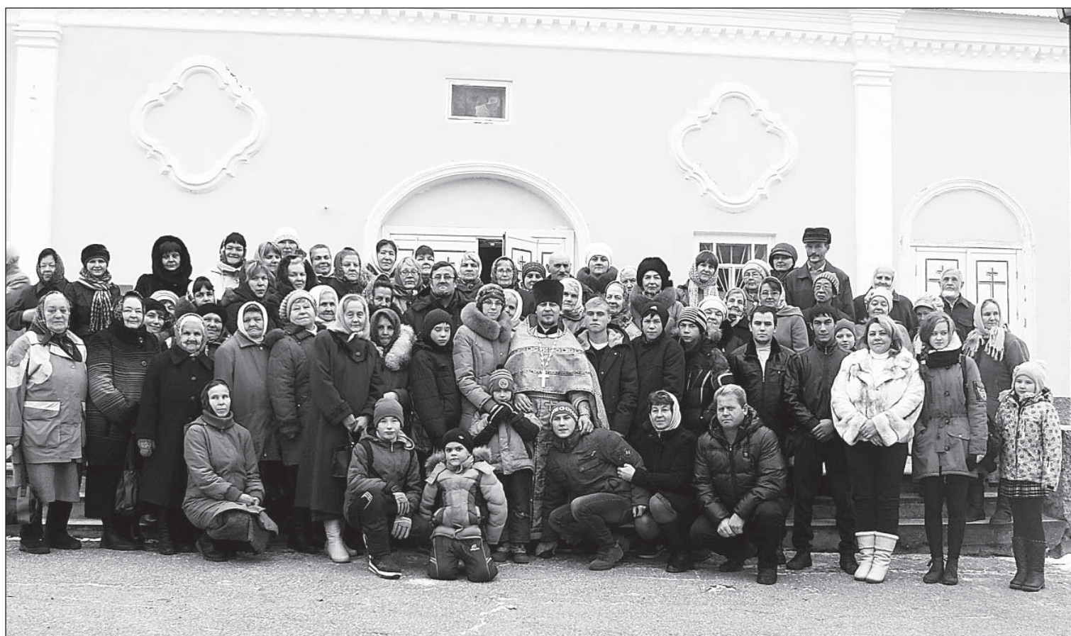
По доброй традиции — фото на память.