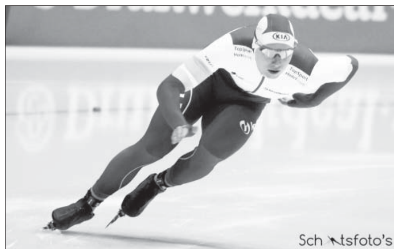
Чемпион на дистанции

Конькобежный спорт давно «ушел под крышу», а беговые коньки усовершенствованы. Это так называемые «клапы» – складывающиеся коньки на пружине. Задник конька выходит из обоймы. Он не прикреплен прочно как, например, на хоккейных или коньках для фигурного катания, что существенно отразилось на технике бега и, соответственно, на скорости конькобежцев.