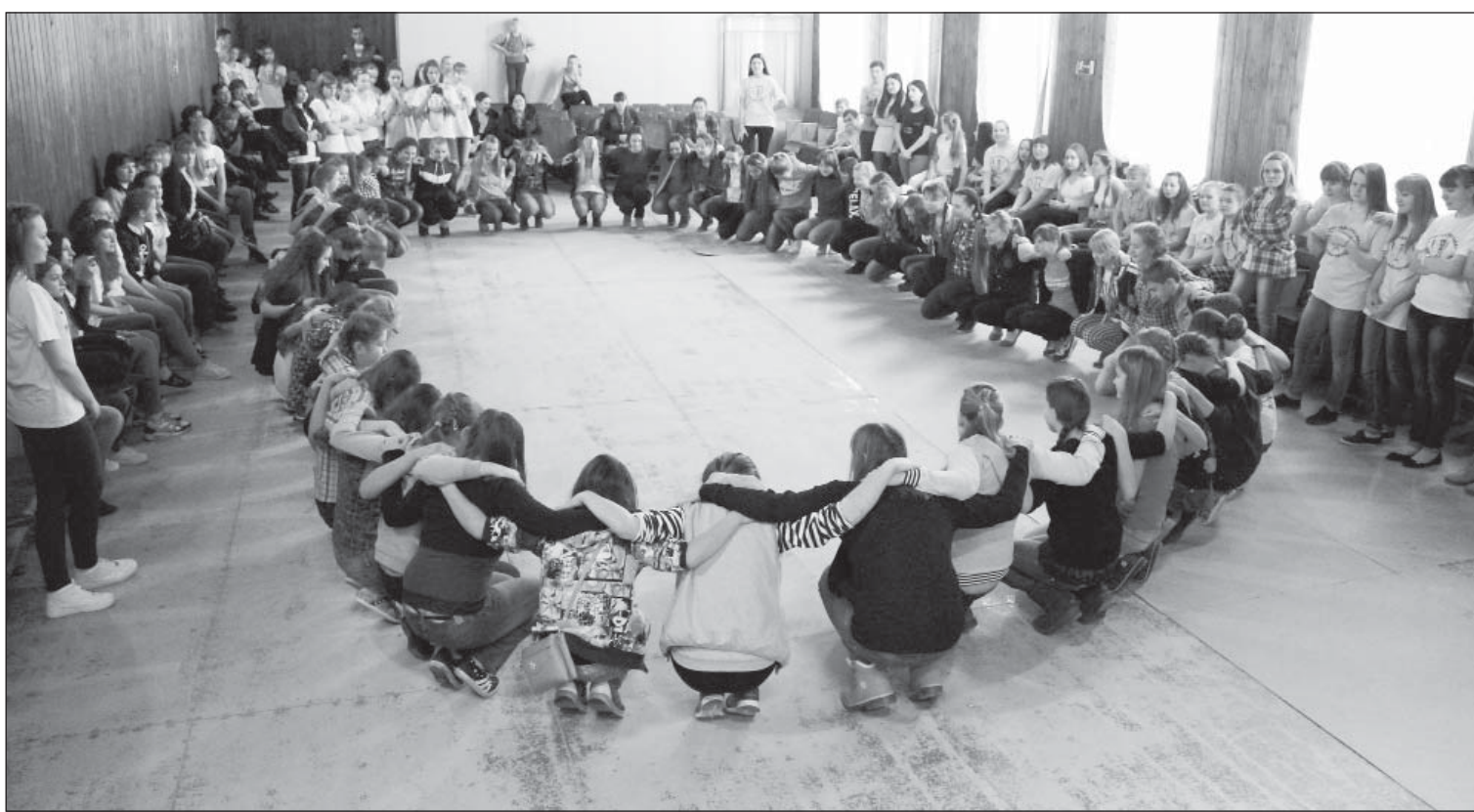
Обряд посвящения в ряды «Альтернативы»