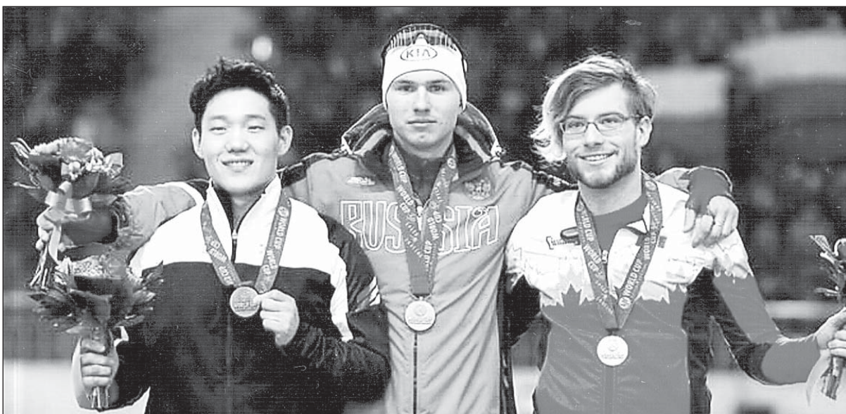
Павел Кулижников (в центре) на пьедестале почета

праву занял «ледяной трон» и возглавил мировую элиту конькобежного спорта. Послужной список впечатляет: 11 золотых медалей (!), Большой хрустальный глобус кубка мира в общем зачете, два малых кубка мира на дистанциях 500 и 1000 метров, звание абсолютного чемпиона мира в спринтерском многоборье. Потрясающий, феноменальный успех российского конькобежца!