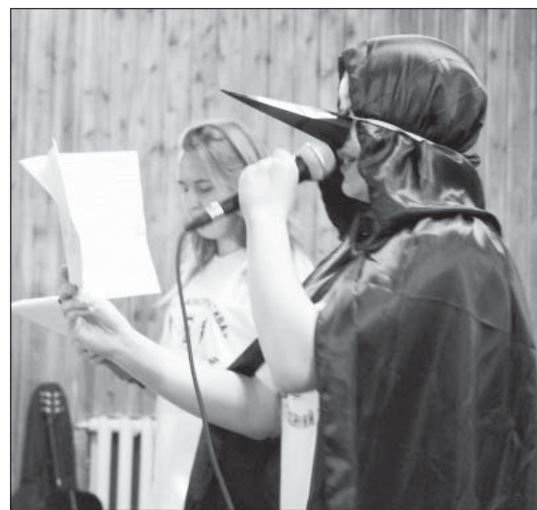
Галчонок — символ организации, зачитывает слова клятвы для новичков