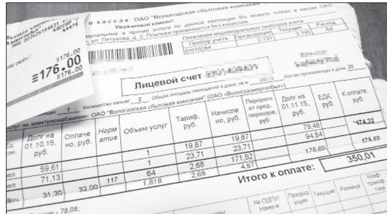
Некоторые верховажане по-прежнему вычеркивают из квитанции платеж «за мусор» и оплачивают только электроэнергию. С нового года к ним примут меры административного воздействия

- Уменьшается, но не так быстро, как хотелось бы. По нашим подсчетам, на сегодняшний день в должниках ходит порядка девяти процентов от общей численности населения. Основная отговорка: «У нас мусора нет», хотя сами пользуются контейнерами. С наступлением нового года у «ВерховажьеСтройСер-