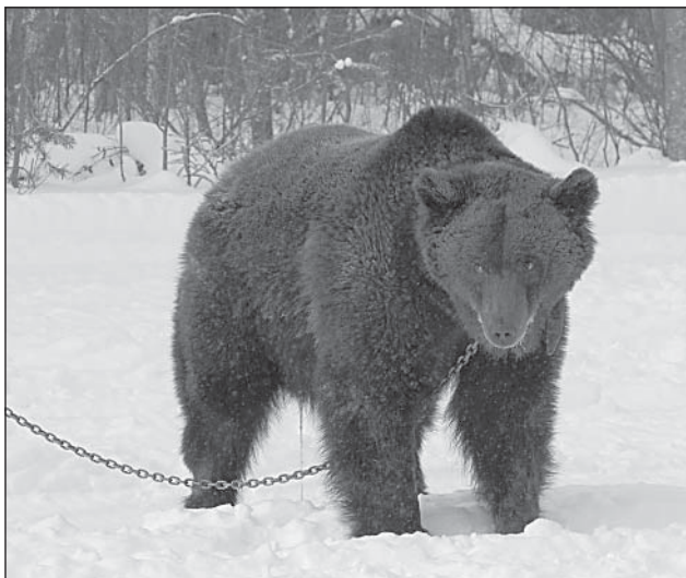
Медведь — объект интереса охотников-профессионалов.

Как объяснили корреспонденту «ВВ» в Верховажском районном отделе по охране и воспроизводству объектов животного мира, существуют определенные тенденции к изменению численности промыслового зверя и птицы.