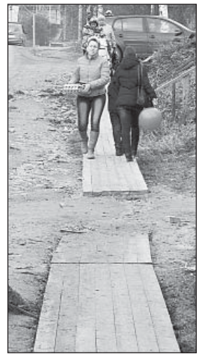
Критика подействовала — сейчас можно спокойно пройти по тротуару и спуститься с лестницы.