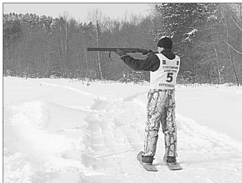
Участник охотничьего биатлона на огневом рубеже.

Кстати, по этому поводу — уникальная охотничья история, вполне заслуживающая занесения в анналы. В Коленьге охотники караулили на вышке медведя, а вышла — волчица. Застрелили. Ждут косолапого дальше — выходит волк. Так что в активе вместо «лицензионного» мишки — два матерых серых хищника.