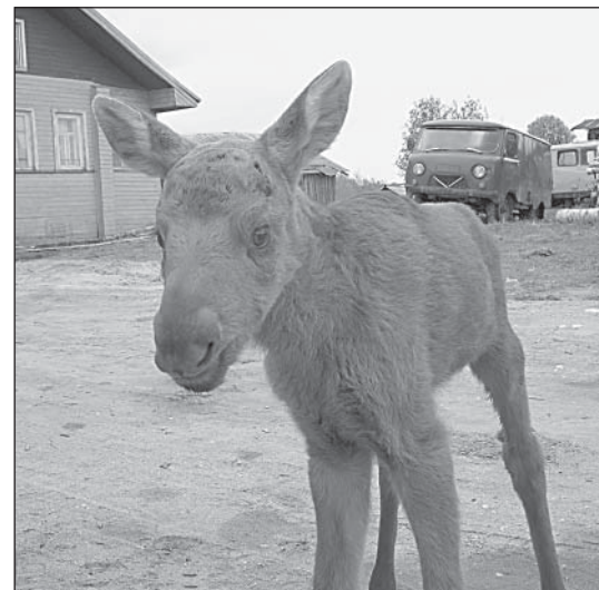
Лосенок Маня, подобранная сердобольными людьми в Шелотах.