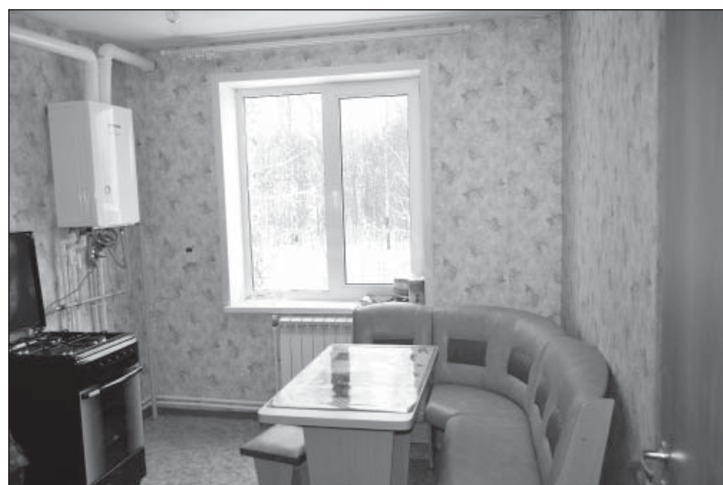
На кухнях установлены газовые плиты и котел