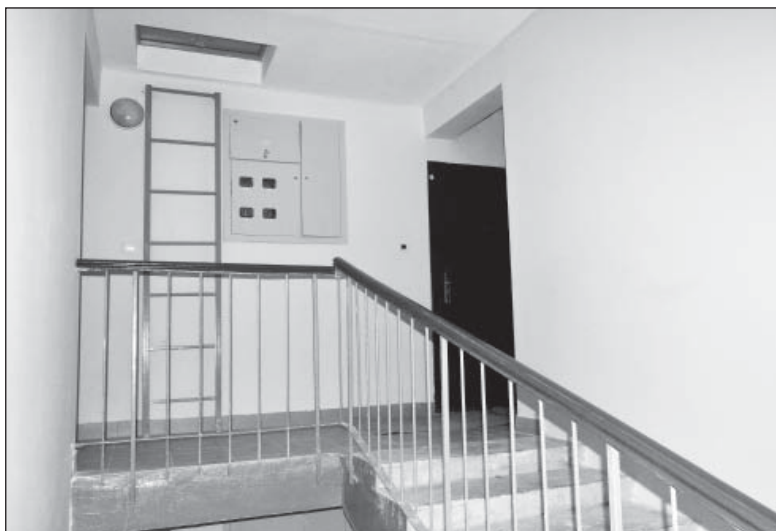
На каждой лестничной площадке четыре квартиры

Переселение граждан из ветхого и аварийного жилья осуществляется на основании Федерального закона от 21 июля 2007 года №185-ФЗ «О фонде содействия реформированию жилищно-коммунального хозяйства».