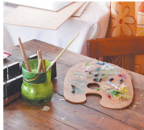
Нехитрые инструменты живописца — кисти и палитра