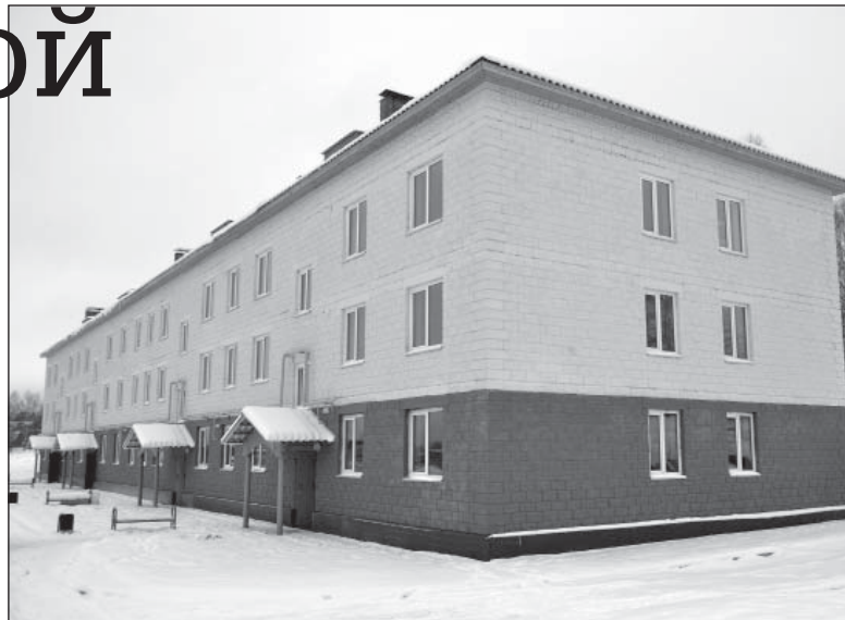
Новый многоквартирный дом на Кошеве готов принять жильцов

новосёлы следили за своими квартирами. Не стоит беспокоиться о неполадках, есть гарантийные сроки. Еще пять лет при возникновении каких-либо проблем подрядчик обязан их устранить. И ещё одна приятная новость. По новому законодательству после введения дома в эксплуатацию его жильцам не надо будет платить за капитальный ремонт жилья в течение пяти лет».