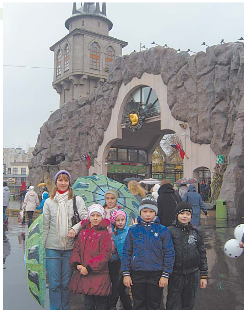
После двух дней соревнований верховажские участники «Кубка Макс-Классика» посетили зоопарк.