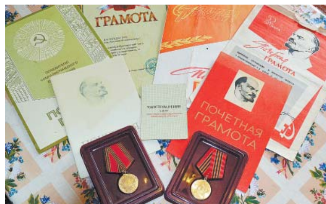
Награды Антонии Илларионовны.