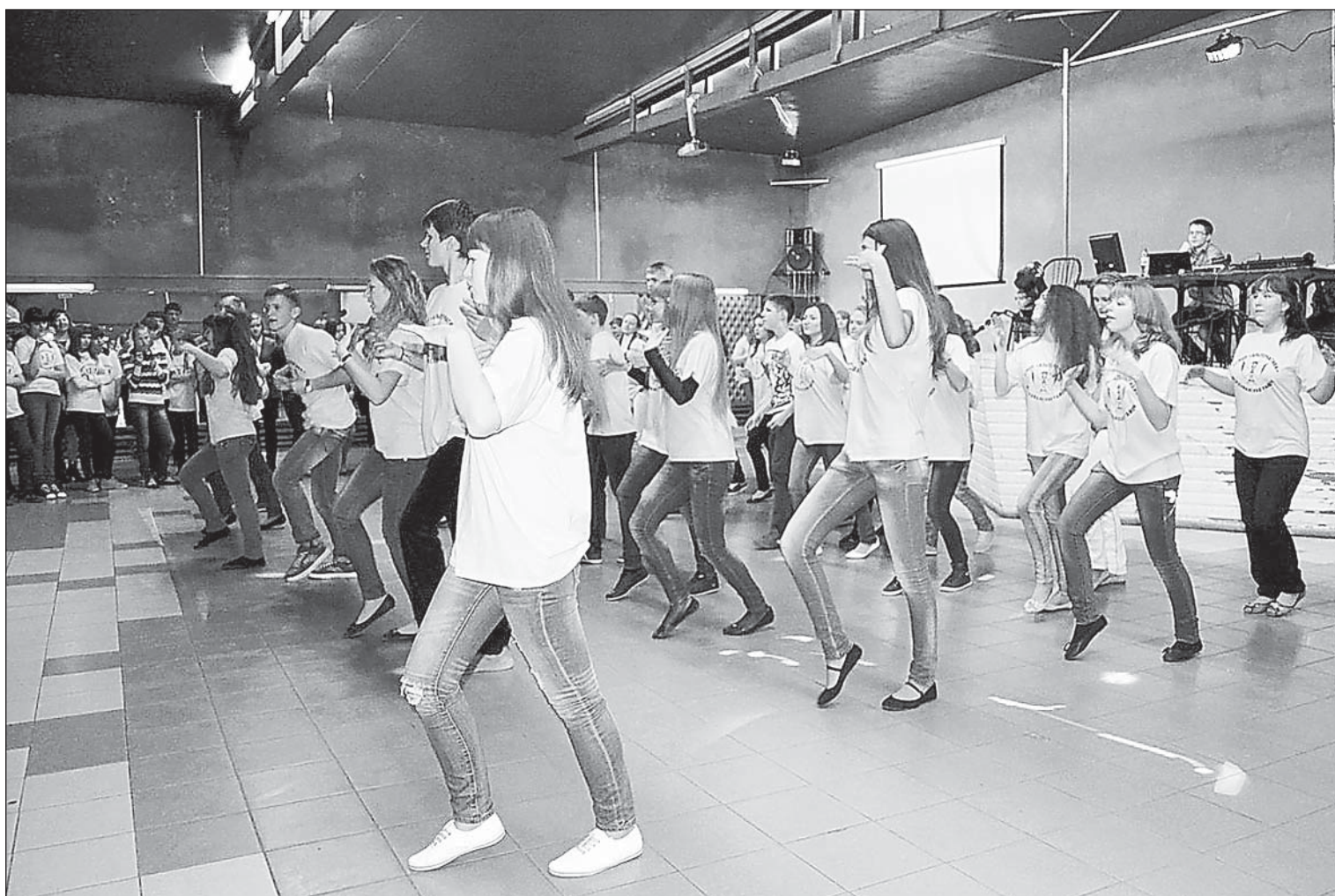
Массовый танец от верховажской первички.