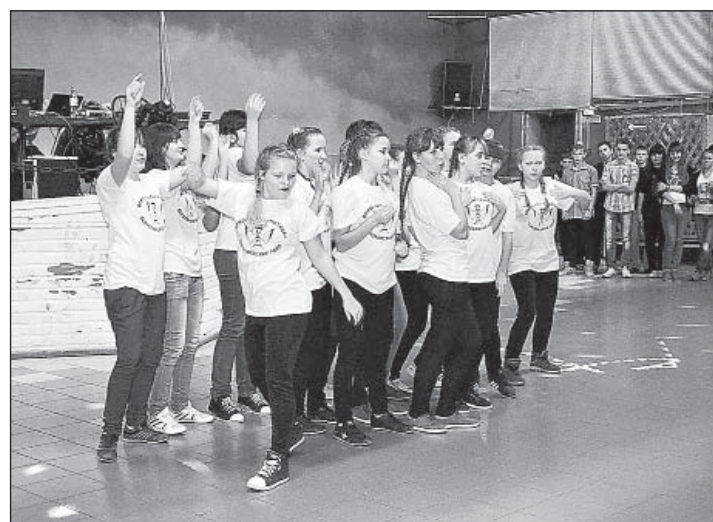
Номер от Н-Кулойского первичного объединения.