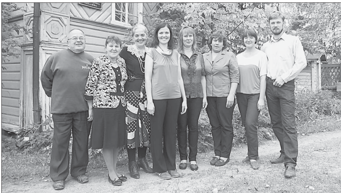
Коллектив Верховажского районного историко-художественного музея.