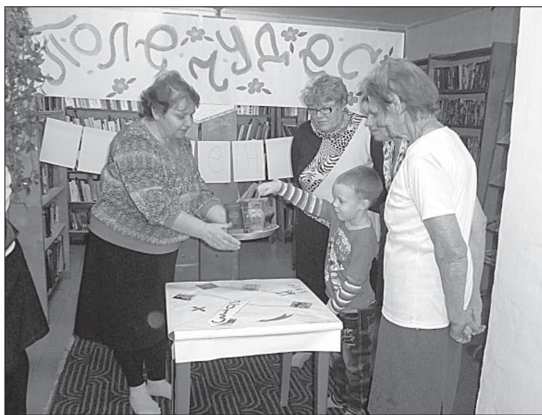
Климушинское «Поле чудес» было не хуже останкинского.