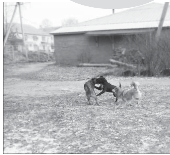
Сейчас псы в Верховажье чувствуют себя привольно.

на от 06.10.2003 года №131-ФЗ «Об общих принципах организации местного самоуправления в Российской Федерации» не содержит таких полномочий, как отлов безнадзорных животных. Указанные полномочия являются прерогативой субъекта РФ и не относятся к полномочиям по благоустройству...». Согласно резолютивной части, раздел 7 должен быть исключен из существующих «Правил...».