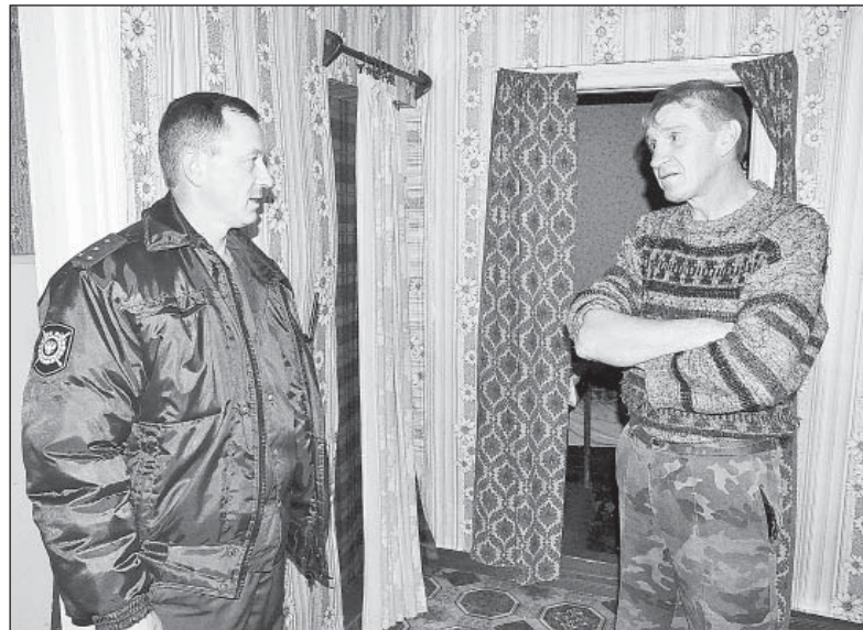
Хозяин одной из квартир в многоквартирном доме закон не нарушает, устроился на работу и делает ремонт.

В 1.30 ночи на пульт дежурного поступил сигнал от молодой женщины о том, что её мама до сих не вернулась с