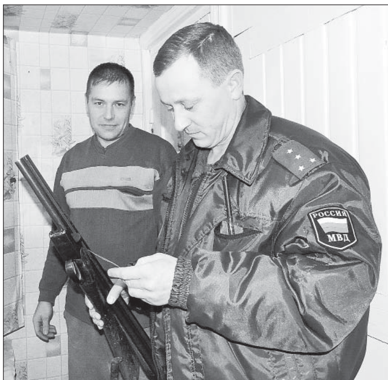
Контроль за соблюдением правил хранения оружия - необходимая работа участкового.

работы. «Потеряшку» нашли и доставили домой.