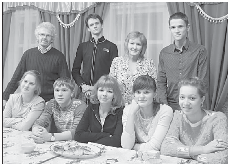
Юные артисты и руководители театра после обсуждения сценария нового спектакля.