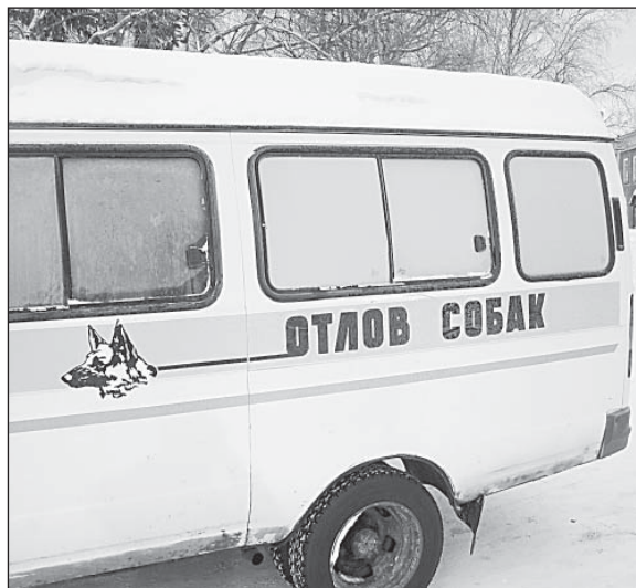
Один вид этой машины внушал собакам трепет.

Документ этот появился на свет как возражения на протест прокурора по поводу решения районного парламента от 19.03.2009 года №18 «О правилах содержания кошек и собак...», точнее, раздела 7 этих правил, предусматривающего отлов безнадзорных кошек и собак. Прокуратура сочла, что решение Представительного Собрания частично противоречит федеральному законодательству и подлежит изменению. Суть противоречия, по мнению надзорного органа, в том, что (цитата): «... Статья 15 Федерального зако-