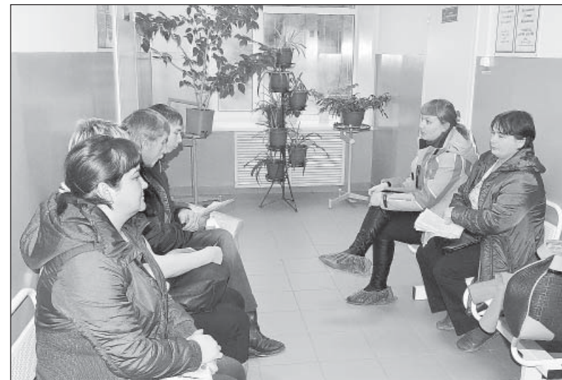
Очередь у кабинета терапевта.

Из-за нашей безалаберности страдают теперь все: врачи