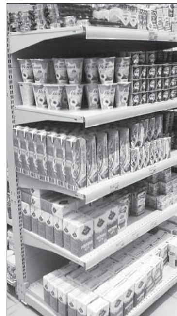
Наша читательница прислала не только вопрос, но и фотографию

Что касается «подозреваемых» из супермаркета «Пятерочка», то они попадают в ряд «долгосрочных» (их срок годности составляет от трех до шести месяцев). Также на каждой упаковке продукта имеется строка о его оптимальной «среде обитания»: хранить при температуре от +2 (+4) до +25° С.