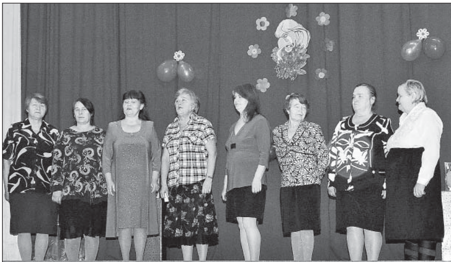
Песня «Рябина кудрявая» в исполнении местного ансамбля художественной самодеятельности.