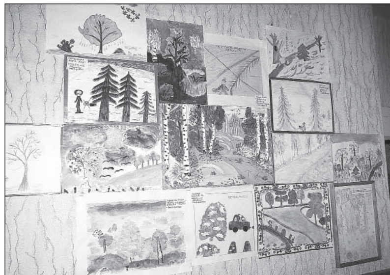
Осенью в районе прошел конкурс детских рисунков «Живи, лес». Как раз на тему воспитания экологической культуры.

По словам докладчика, план по лесовоспроизводству в нынешнем году был выполнен на 100 процентов. Контролируется и качество восстановления лесных насаждений. Проверка проводится на первом, третьем и пятом годах. Если приживаемость хуже плановых показателей, выполненные посадки попросту не пой-