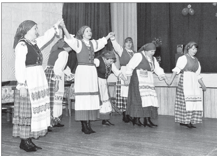
Фольклорный коллектив «Кукушечка». Хоровод «Уж мы сеяли лен».