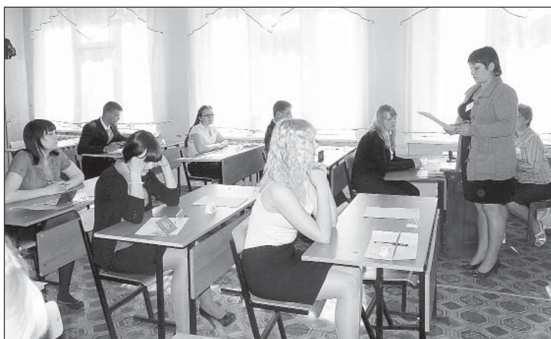
Инструктаж перед ЕГЭ по математике, 2012 год.

В связи с этим среди наиболее важных задач в Комплексе мер по модернизации системы общего образования на 2013 год Людмила Рудольфовна выделила повышение заработной платы педагогических работников общеобразовательных