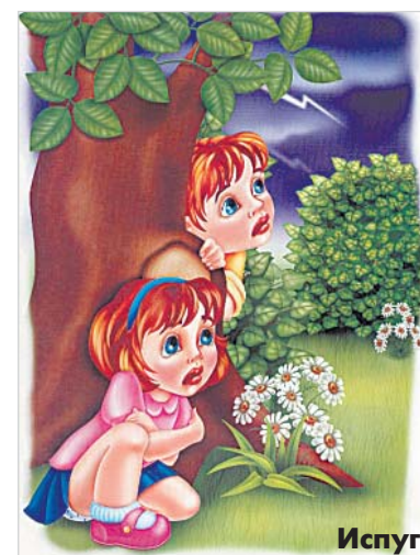
Изучать эмоции можно с помощью картинок.