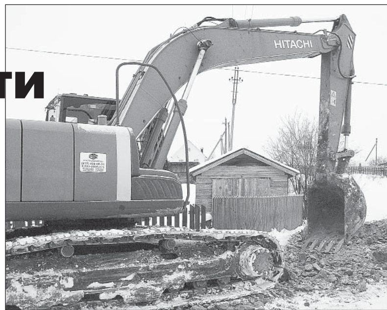
Число пользователей центрального водопровода увеличивается год от года.

Теперь о водоснабжении райцентра. Начиная со следующего года, эту обязанность берет на себя «Теплосеть» — давний и проверенный игрок на верховажском рынке услуг. Руководство предприятия всерьез намерено наве-