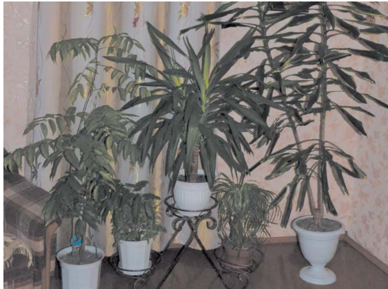
Готовясь к зиме, не забудьте про комнатные растения.

Чтобы помочь растениям адаптироваться к зимнему сезону, до холодов, а лучше еще раньше, нужно начинать закалывающие процедуры. В первую очередь, следует сократить количество поливов, оставив на первые несколько недель лишь утренние три раза в неделю. Постепенно уменьшить количество поливов до одного раза в неделю (утром или днем). Утром температура влажного земляного кома успевает подняться, поэтому растение уже не боится ночных переохладений. Главное, сливать из поддона воду, чтобы корни не начали подгнивать. Чтобы проверить, нуждается