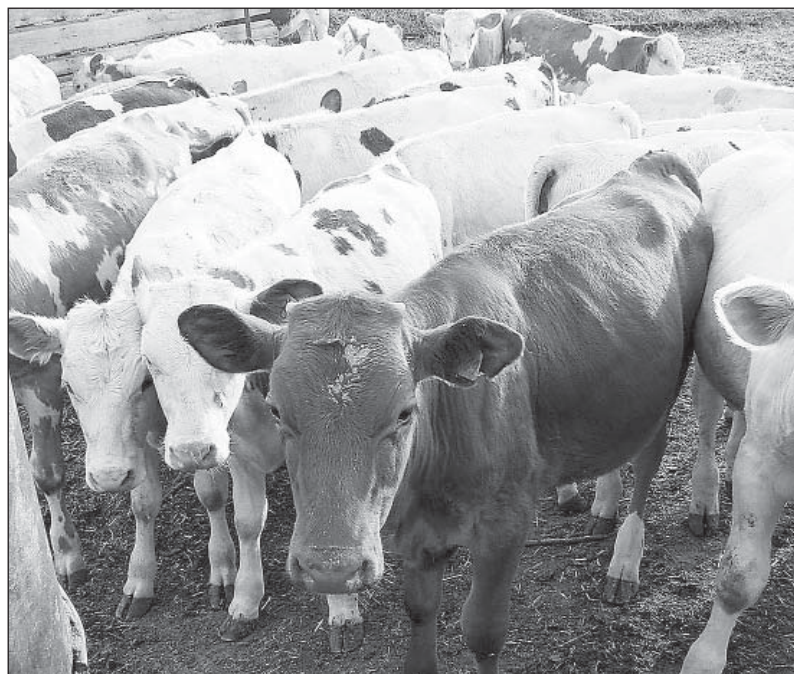
Будущее мясо и молоко.

28-29 ноября в департаменте сельского хозяйства, продовольственных ресурсов и торговли прошло совещание с участием руководителей и специалистов департамента, начальников и главных специалистов агрономической, инженерной и зооинженерной служб районных управлений сельского хозяйства. На рассмотрении был вынесен вопрос: «Об итогах работы отраслей АПК и задачах на 2014 год в рамках реализации государственной программы «Развитие агропромышленного комплекса и потребительского рынка Вологодской области на 2013-2020 годы».