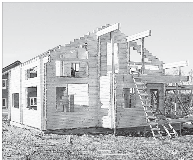
Строительство дома из клееного бруса.

При этом производительность труда увеличится в 2,2 раза, заработная плата работающих — в два раза. Платежи в бюджеты всех уровней вырастут в 4 раза, а в социальные фонды — в 2,7. Это создаст условия не только для увеличения