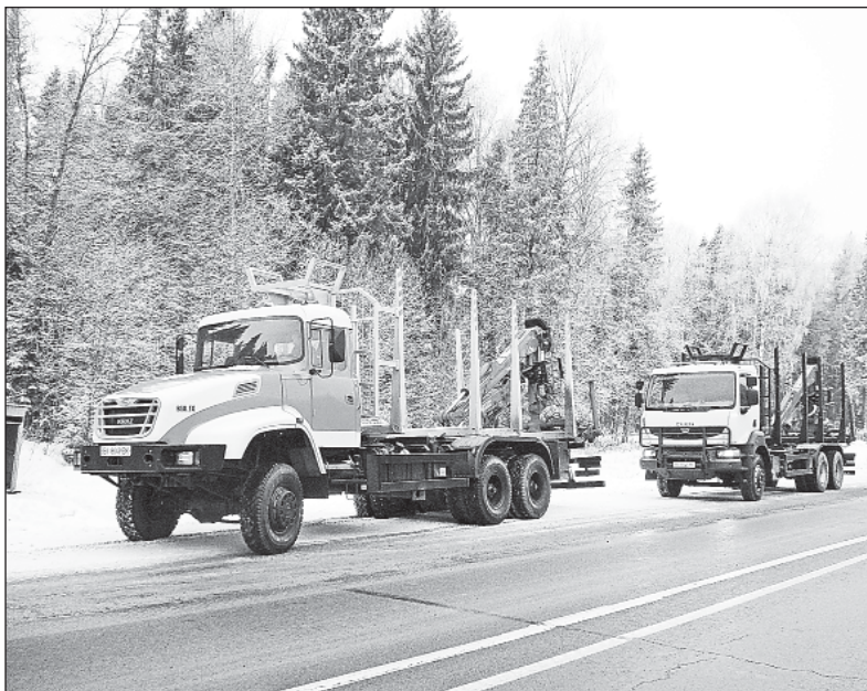
Эта техника используется для заготовки древесины.

заработной платы работникам социальной сферы, но и для восстановления ранее закрытых социальных объектов (больниц, медпунктов, школ и дошкольных учреждений, пекарен, столовых, домов культуры, домов быта, пансионатов для одиноких престарелых жителей и так далее), а также создания новых. Появится возможность строить в поселках благоустроенное жилье с полным инженерным обеспечением как методом индивидуального строительства с использованием ипотечного кредитования, так и за счет средств предприятий и местных бюджетов.