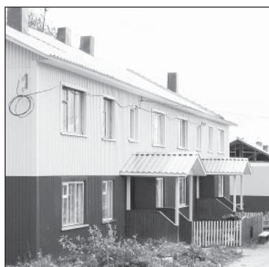
Многоквартирный дом после капитального ремонта.

С 2014 года жильцов многоквартирных домов ждут изменения в проведении капитального ремонта. Собственники жилых и нежилых помещений будут обязаны ежемесячно вносить взносы на ремонт общего имущества. Исключение составляют лишь те дома, которые признаны аварийными и подлежат сносу. Эта обязанность собственника возникла с принятием Федерального закона №270. В соответствии с ним внесены серьезные изменения и в Жилищный кодекс РФ. В числе 17 российских регионов в Вологодской области определен размер тарифа на капитальный ремонт – 60 коп. с квадратного метра в месяц.