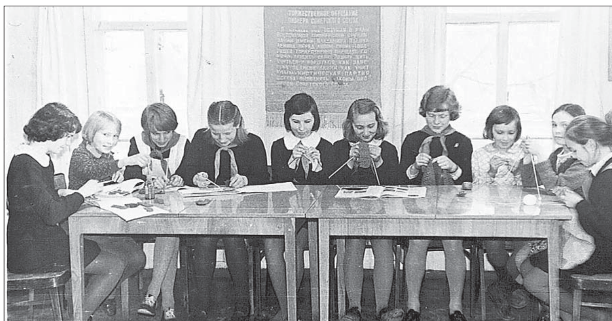
На занятиях в Доме пионеров каждый находил себе дело по душе.

В своей работе Дом детского творчества в первую очередь учитывает потребности семьи, школы и общества. С каждым годом увеличивается число объединений по интересам детей. В 2013 году в верховажском Доме детского творчества занимается почти 700 детей в возрасте от 6 до 18 лет, работают 19 педагогов дополнительного образования. Занятия проходят не только в зданиях ДДТ и его филиалов в с. Верховажье, д. Урусовской, с. Чушевицы, в ДК в д. Куколовской, но и на базе школ в с. Верховажье, с. Сметанино, с. Шелота, с. Липки. Наши педагоги проводят занятия с воспитанниками детских садов в с. Верховажье, с. Сметанино,