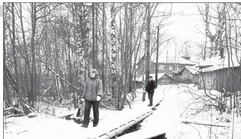
Прохожие благодарны за удобный тротуар.

Некоторые не верили, но реакция со стороны муниципалитета последовала почти мгновенно. Для строительства были выделены и привезены на место гвозди и четыре кубометра стройматериалов. На субботник собрались