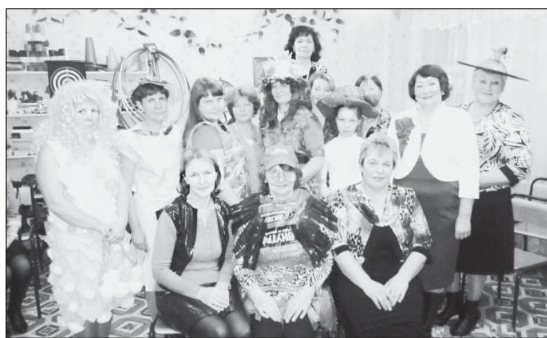
Участницы «Хлам-шоу» поразили зрителей своими нарядами.