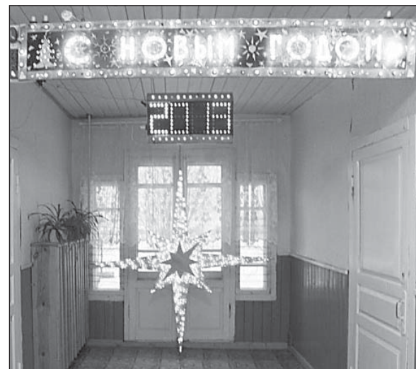
Проект «Новогодняя звезда» очень заинтересовал жюри и участников конкурса.