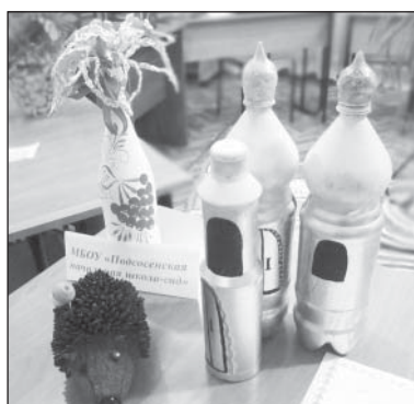
Поделки из бросового материала учеников Подсосенской школы-детского сада.