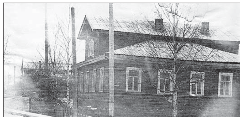
В этом здании на ул. Тотемской с 1977 по 1991 год располагался Дом пионеров, а с 1991 по 1996 год - Дом детского творчества.