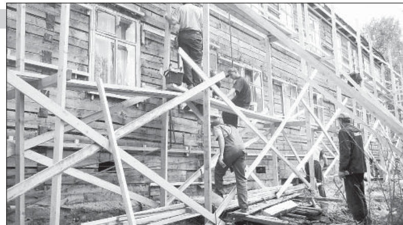
Капремонт многоквартирных домов в Верховажье, лето 2010 года.

Если деньги будут аккумулироваться на спецсчете, то собственники сами вправе решить, как их потратить. Несколько другая ситуация, когда взносами станет распоряжаться региональный оператор. Возможно даже, что отдельные виды работ по капитальному ремонту дома будут запланированы на разные годы реализации программы.