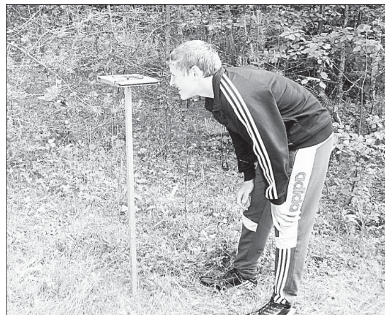
Измерение прямого и обратного азимута — дело тонкое.

радиоактивности мы определили мощность гамма-излучения (мощность экспозиционной дозы) в контрольной точке и в «зоне». Мощность дозы во всех точках практически одинакова и составляла от 0,09 до 0,11 мкЗв/ч. Это не превышает нормы радиационного фона (до 1,2 мкЗв/ч.) Других избыточных излучений мы тоже не обнаружили. Имеющиеся у нас механические и электрические приборы: часы, секундомеры, радио, калькуляторы, электронные измерительные приборы сбоят в «зоне» не давали.