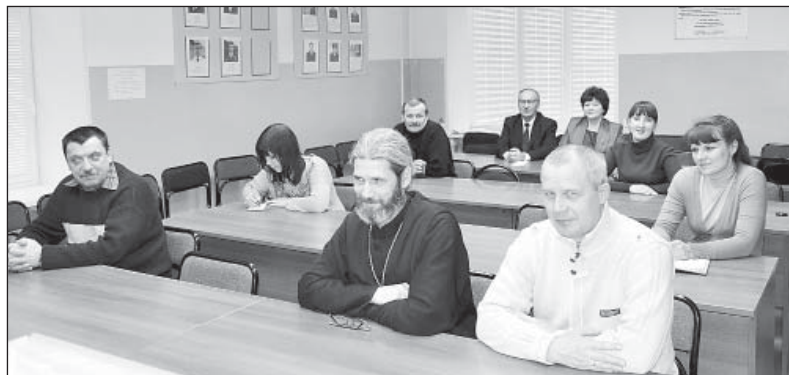
Идет заседание Общественного совета.